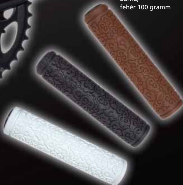
Markolat Spyral Analogue fekete, barna, fehér 100 gramm

Információ: www.megabikeltd.hu /www.spyral.hu