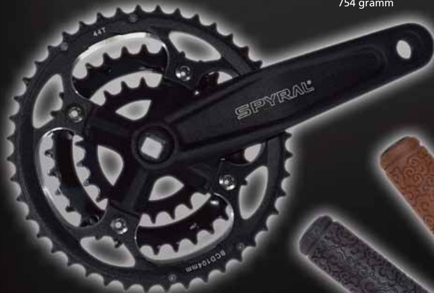
Hajtómű Spyral Tour 22/32/44AL 170mm 754 gramm