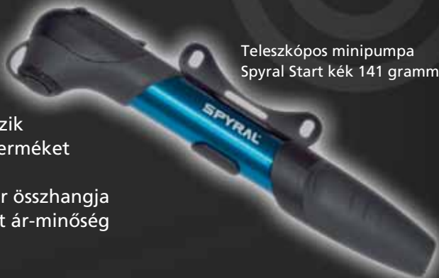
Teleszkópos minipumpa Spyral Start kék 141 gramm

pedálok, markolatok, kormányok, kormányzárak, kormányoszlopok, kormánycsapágyak, pumpák, monoblokkok, hajtóművek, nyergek, fékek, fékkarok, fékbetétek, szerszámok, kesztyűk