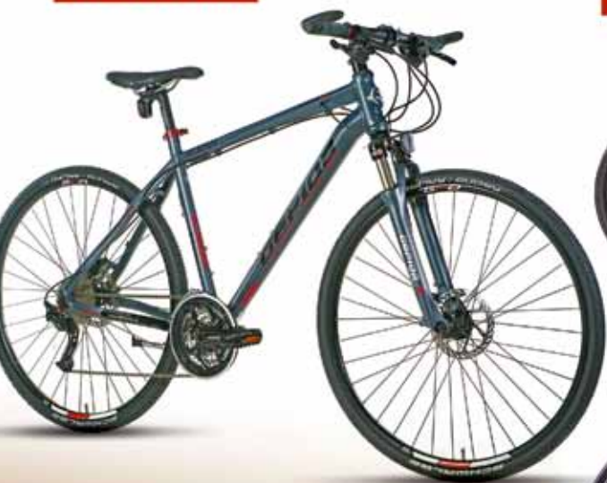
ALBOIN 900 CRS