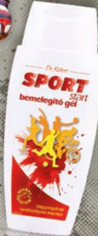
Dr.Kelen Sport START bemelegítő gél