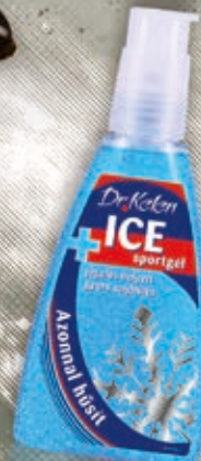
Dr.Kelen Sport ICE gél jégelés helyett

Tartósítószer- és illatanyagmentes készítmények az egészségtudatosság jegyében.