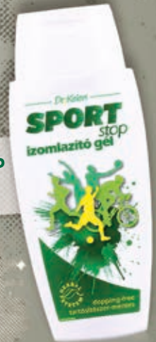
Dr.Kelen Sport STOP izomlazító gél