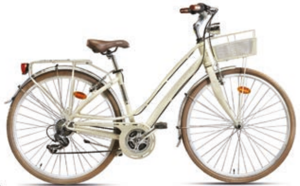
Blue City városi kerékpár