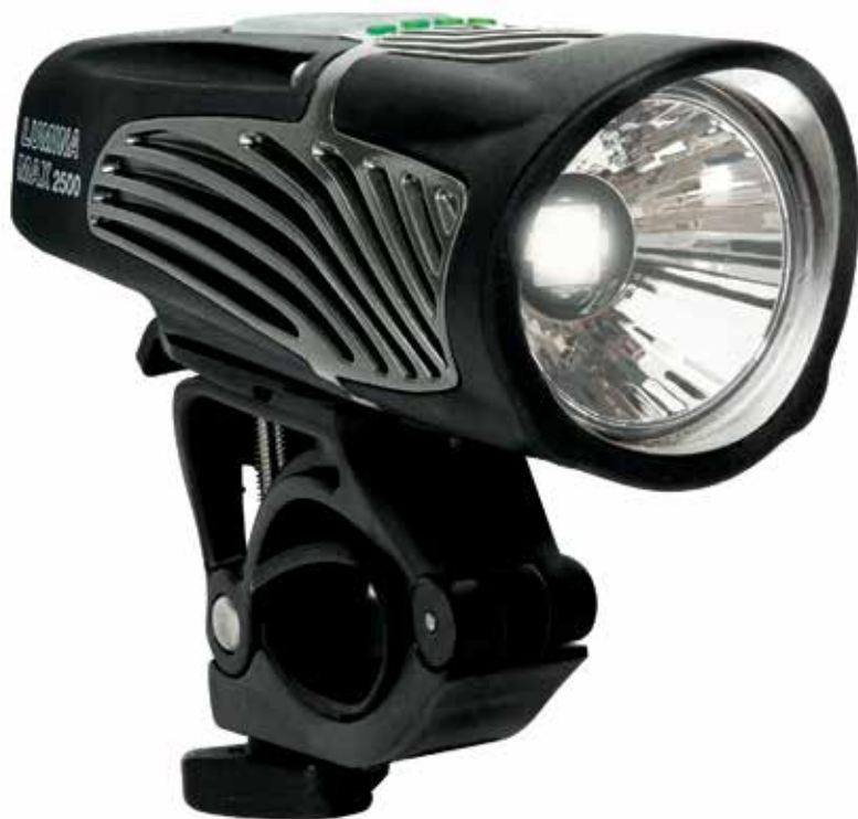
Nite Rider Lumina Max 2500 lámpa

Utat mutat neked utat mutat az iparágnak