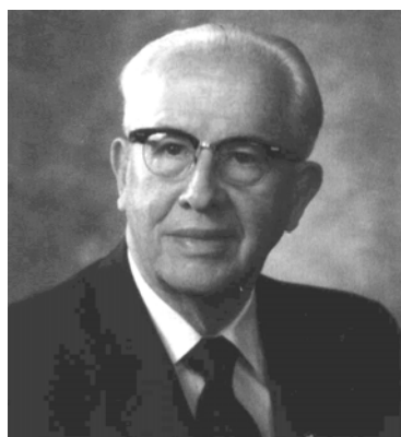
10. ábra: Ezra Taft Benson