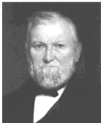
6. ábra: Wilford Woodruff