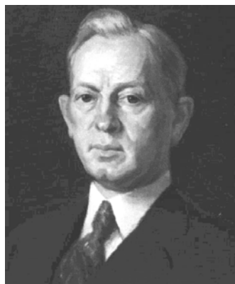
8. ábra: Joseph Fielding Smith