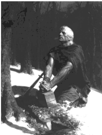
3. ábra: Moroni elrejt az aranylemezeket