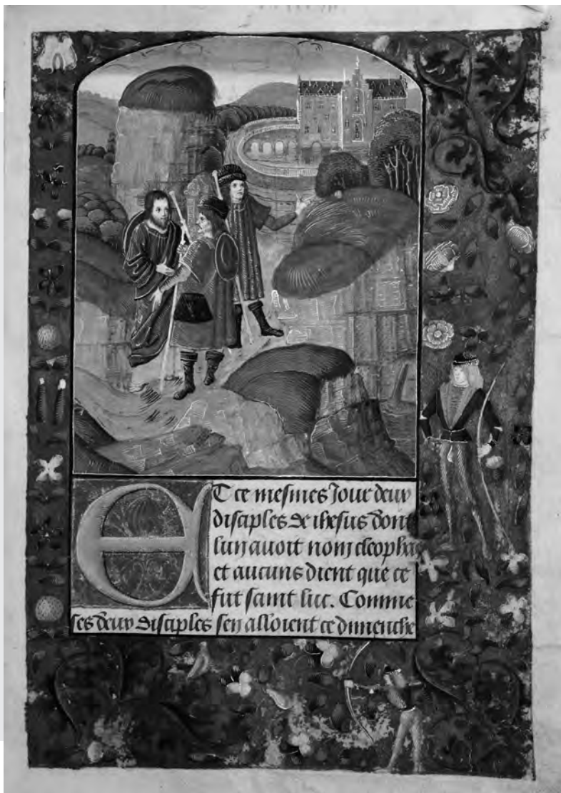
Krisztus az Emmaus felé vezető úton megjelenik két tanítványának. Az evangéliumi történet egy francia kódex miniatúráján. (1503 körül)