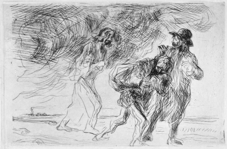
Jean Louis Forain (1852–1931): Úton Emmausba.