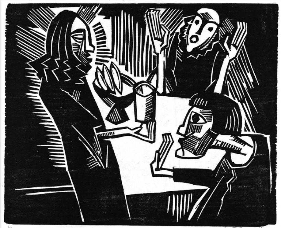
Karl Schmidt-Rottluff (1884–1976): Emmaus (1918)