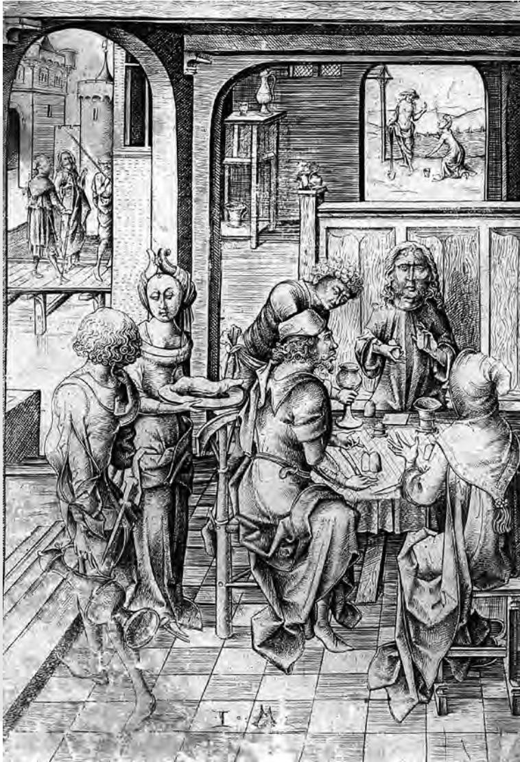
Az emmausi vacsora. Ismeretlen alkotó fametszete. A kép háttérében két evangéliumi jelenet látható: balra az emmausi úton a tanítványoknak megjelenő Krisztus, középen pedig Mária és a feltámadt Jézus találkozása. (1480 körül)