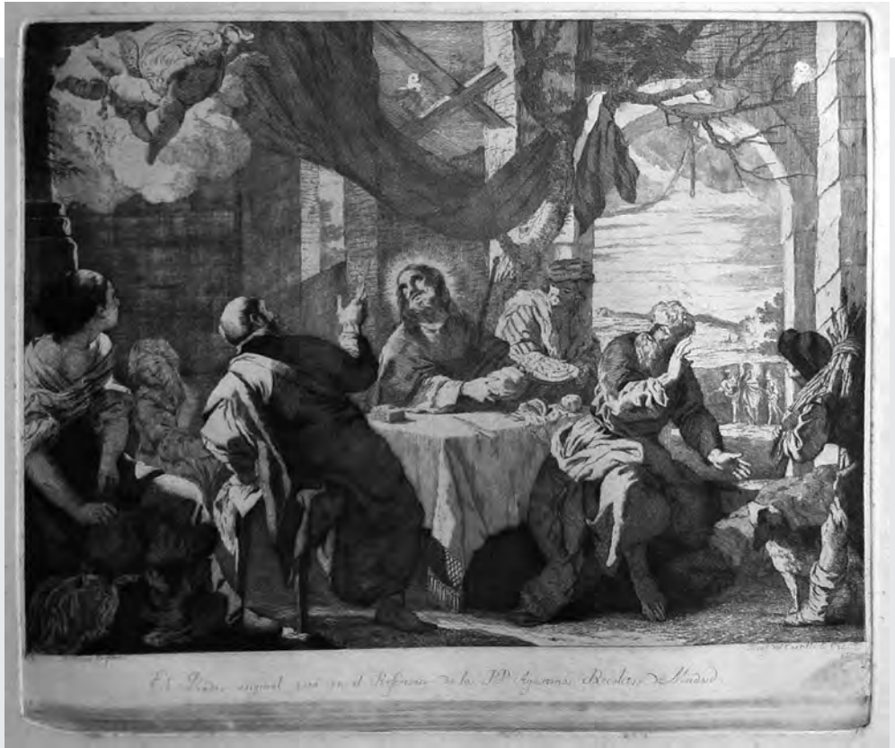
José del Castillo: Jézus megjelenése az emmausi tanítványoknak. Rézmetszet. (1778)