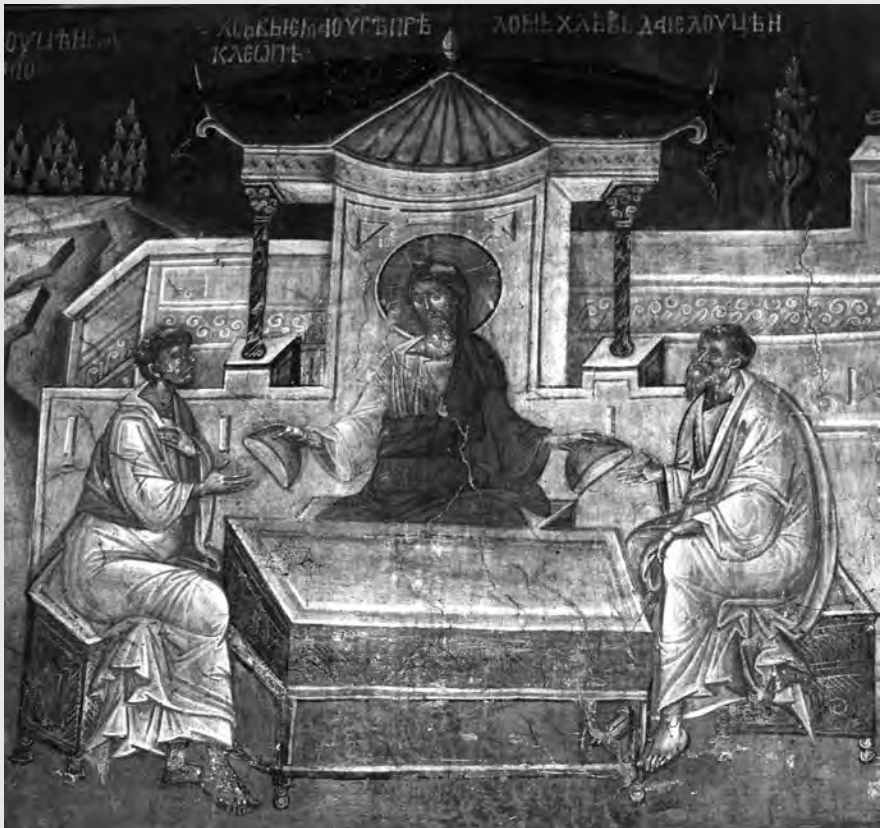
Az emmausi vacsora freskója a koszovói Gračanica szerb ortodox kolostorában. (1321)