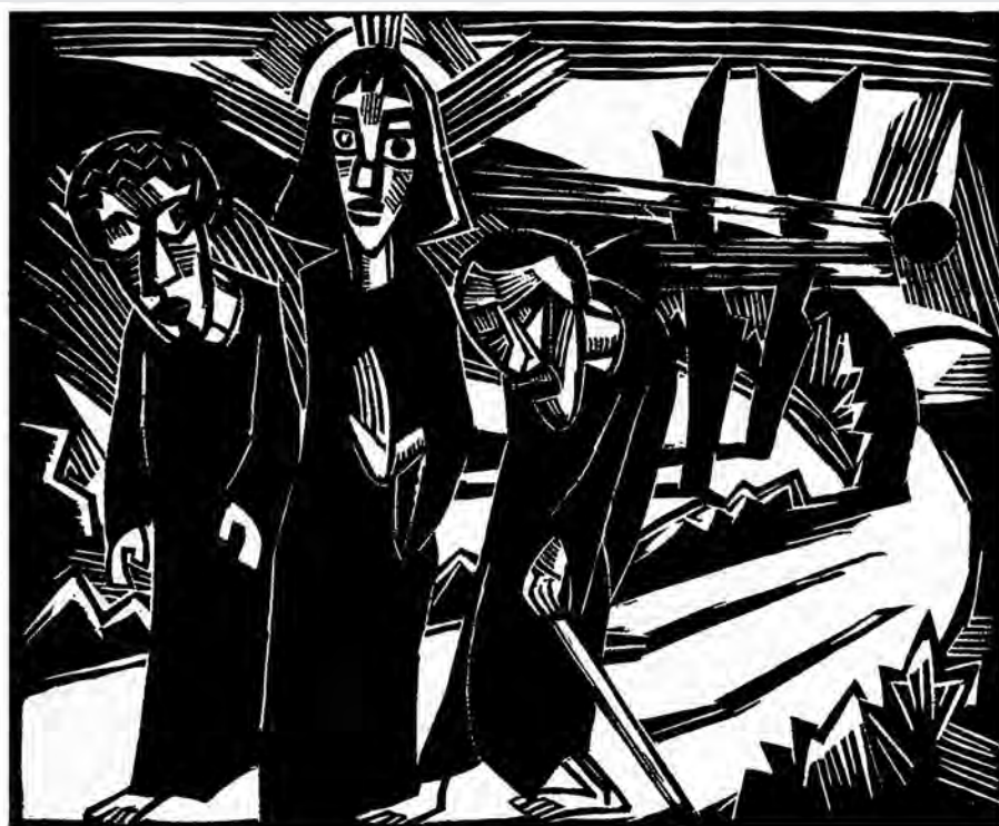
Karl Schmidt-Rottluff (1884–1976): Úton Emmausba. (1918)