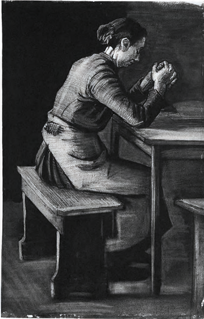
Vincent van Gogh: Imádkozó nő. 1883.