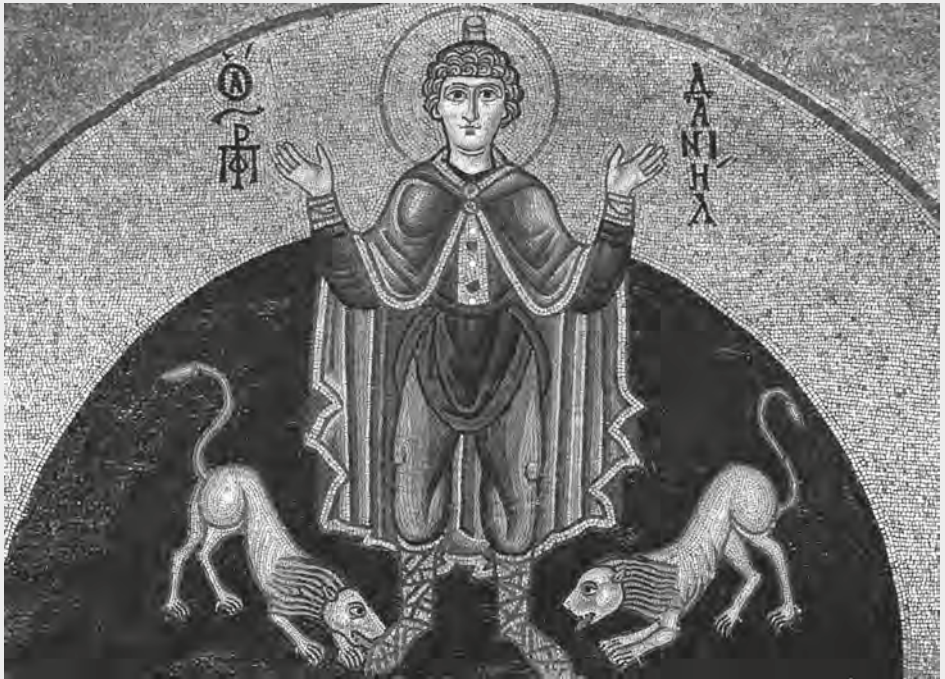
Dániel az oroszlánok vermében. 10. századi mozaik. A képen Dániel imádkozó kéztartással áll, mellette az oroszlánok mint gazdájuk lábát nyaldosó kutyák. Az oroszlánok vermébe zárt Dániel elbeszélése a kétségeivel, vagy éppen a halállal szembenező ember küzdelmének allegóriájává lett.