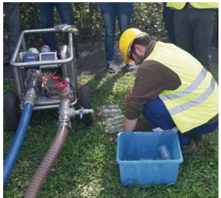
A kifolyó víz analízisének

A berendezés könnyen mozgatható „kocsira” szerelt kialakítású, oly módon, hogy az adatokat online megjeleníti, illetve tárolja, biztosítva azok későbbi időpontban történő kinyerését a dokumentáláshoz. A berendezést egy vízkormányzó résszel is ellátták, lehetőséget teremtve különböző minőségű víz elhelyezésére.