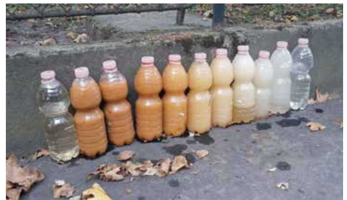
A tisztítás során vett vízminták

megállapítható, hogy mindenféleképpen létjogosultsága van a tisztítási palettán a fent sorolt előnyök miatt. Alkalmazása tekintetében a nagy népsűrűségű, intézményekkel teli városrészekben célszerű alkalmazni, ahol a tisztításra számítható idő korlátozott, illetve a tisztításból származó egyéb problémák (tisztítóelem elvesztése, beszorulása) komoly kockázati tényezőket jelentenek.