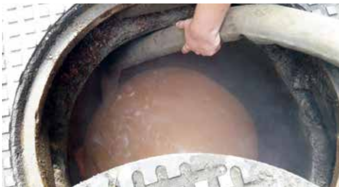
Jégkása által szállított szennyezett víz

A szegedi tisztítás során a használt jeget és az öblítővizet közvetlenül a közcsatornába ürítették, így szennyvíztartály alkalmazására nem került sor. Olyan helyeken, ahol nem áll rendelkezésre megfelelő befogadó a tisztítási tevékenység során keletkezett szennyezett víz és jég elhelyezésére, ott ezeket tartálykocsiban szükséges összegyűjteni. A tartályt 2 db visszacsapó szelep alkalmazásával lehet csak a hálózatra csatlakoztatni az esetleges visszafertőzések elkerülése érdekében. 10 ezer liter jégkásából mintegy 18 ezer liter szennyezett víz keletkezik.