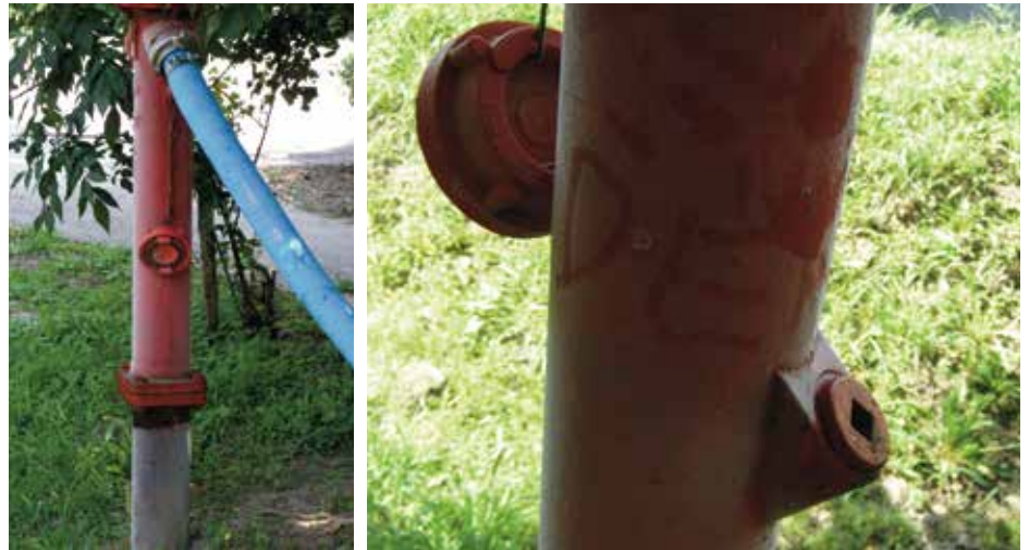
A tűzcsap deresedése