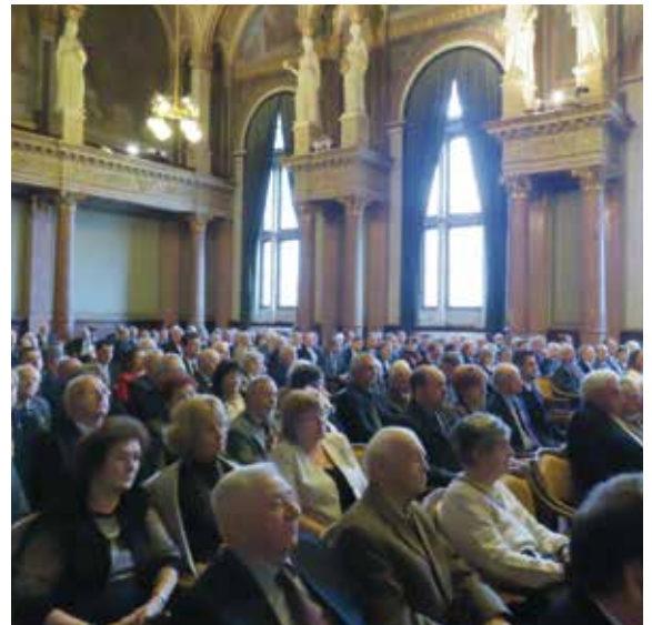
MHT centenáriumi emlékülés