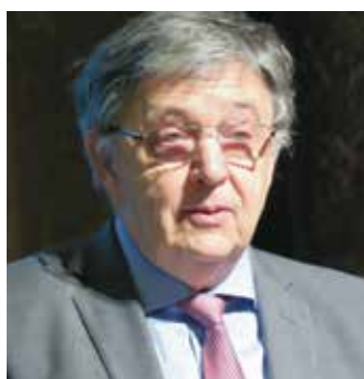
Dr. Lovász László