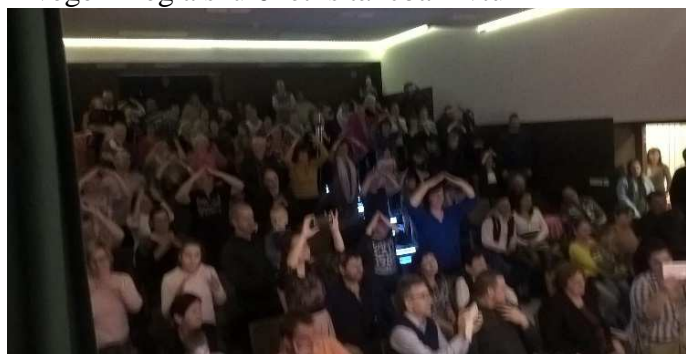
Télűzés ovis módra