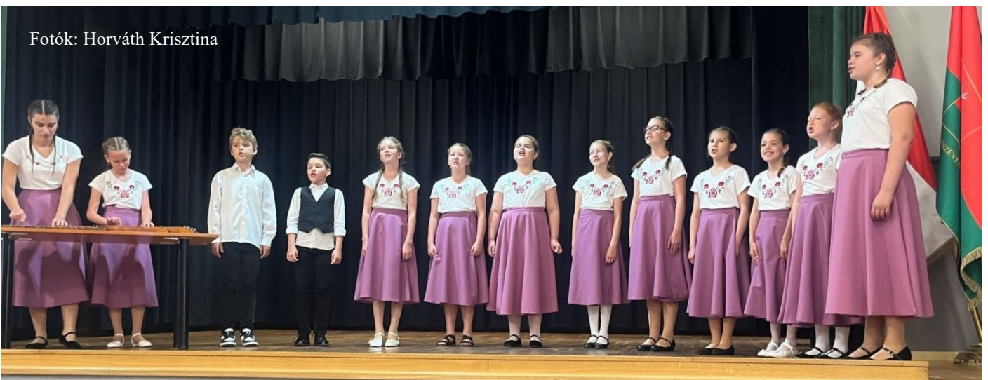
A kisebbek alkotta Kaláris Énekegyüttes is bejutott a Vass Lajos Népzenei Verseny Kárpát-medencei döntőjébe.