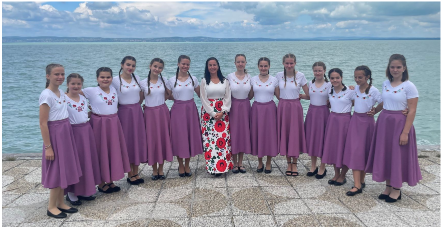
A Kövirózsa Énekegyüttes a Népek tánca - népek zenéje verseny országos döntője után Siófokon.

- Ilyenkor adódik alkalom arra is, hogy vendégül lássuk a fertőszentmiklósi partneregyüttesünket és egyszerre felvonultassuk a csoportjainkat az óvodásoktól a felnőttekig. Idén is így lesz; fellépnek a néptáncosaink, az énekesek és a citerások is. Jó visszajelzés ez a szülőknek is, akik láthatják a gyerekek fejlődését, a műsorunk második felében pedig