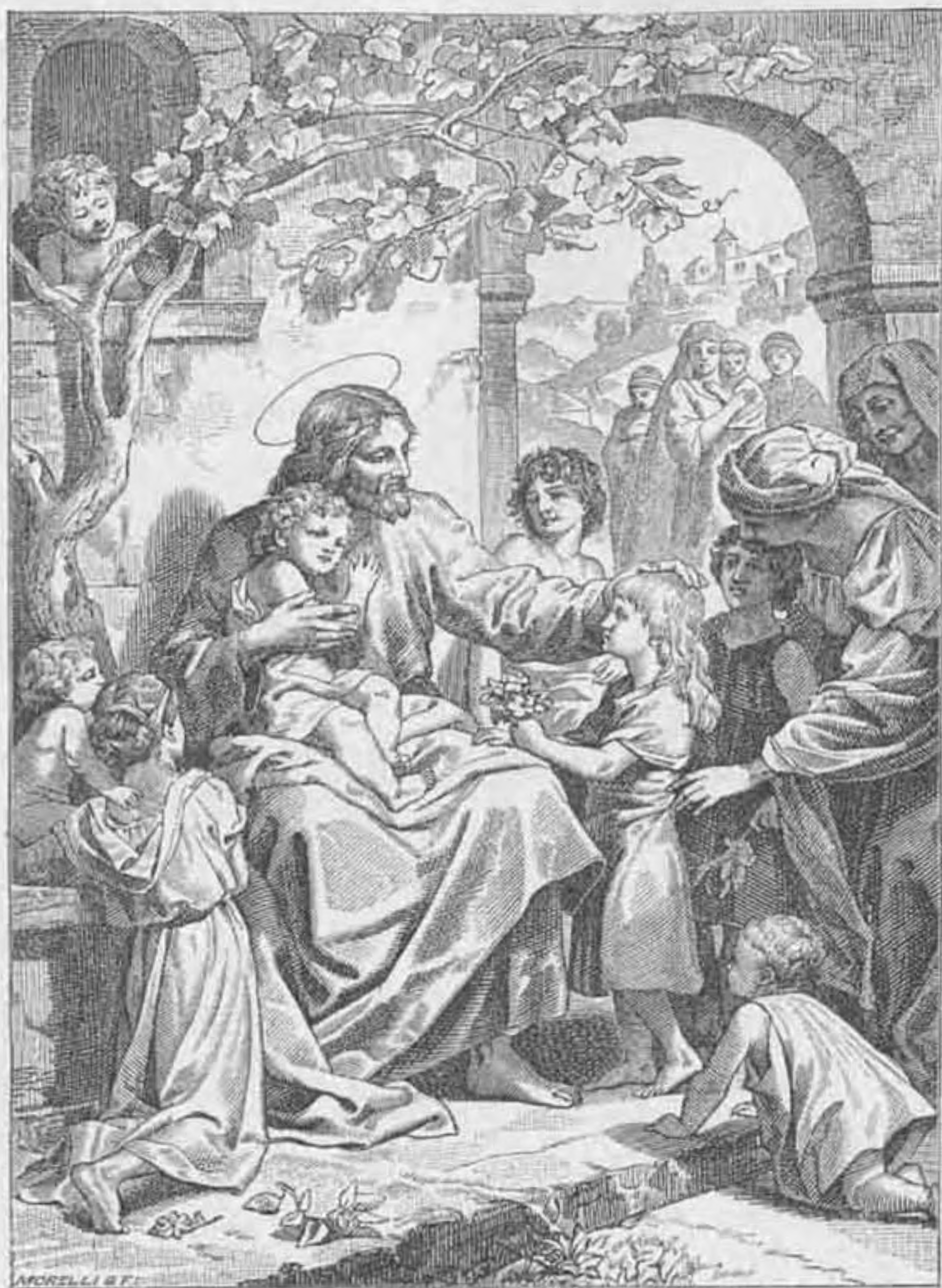
Jézus szeretete a gyermekek iránt.