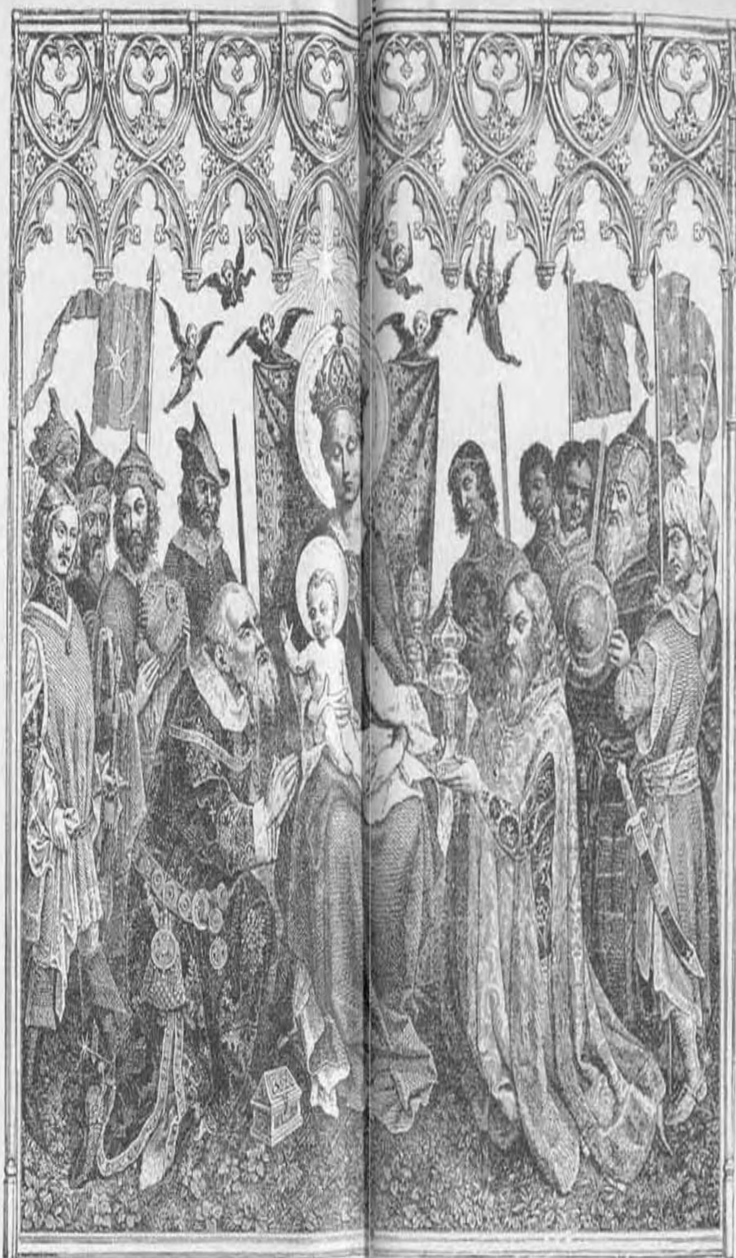
A napkeleti bölcsek hódolata.

Végzetlen jóleső nyugalom vette körül egész lényemet; megnyílt előttem a hitélet gyönyörűsége; de egyszerre csak egy bizonyos félelem kezdte szívemet körülhálózni. Félelem a fölött, hogy elveszthetem azt, a mim van ; elveszthetem az Isten szeretetét, az Isten jóságát. Mitől féltem, magam sem tudom. Mindenesetre külső befolyástól vagy önönmagamhoz