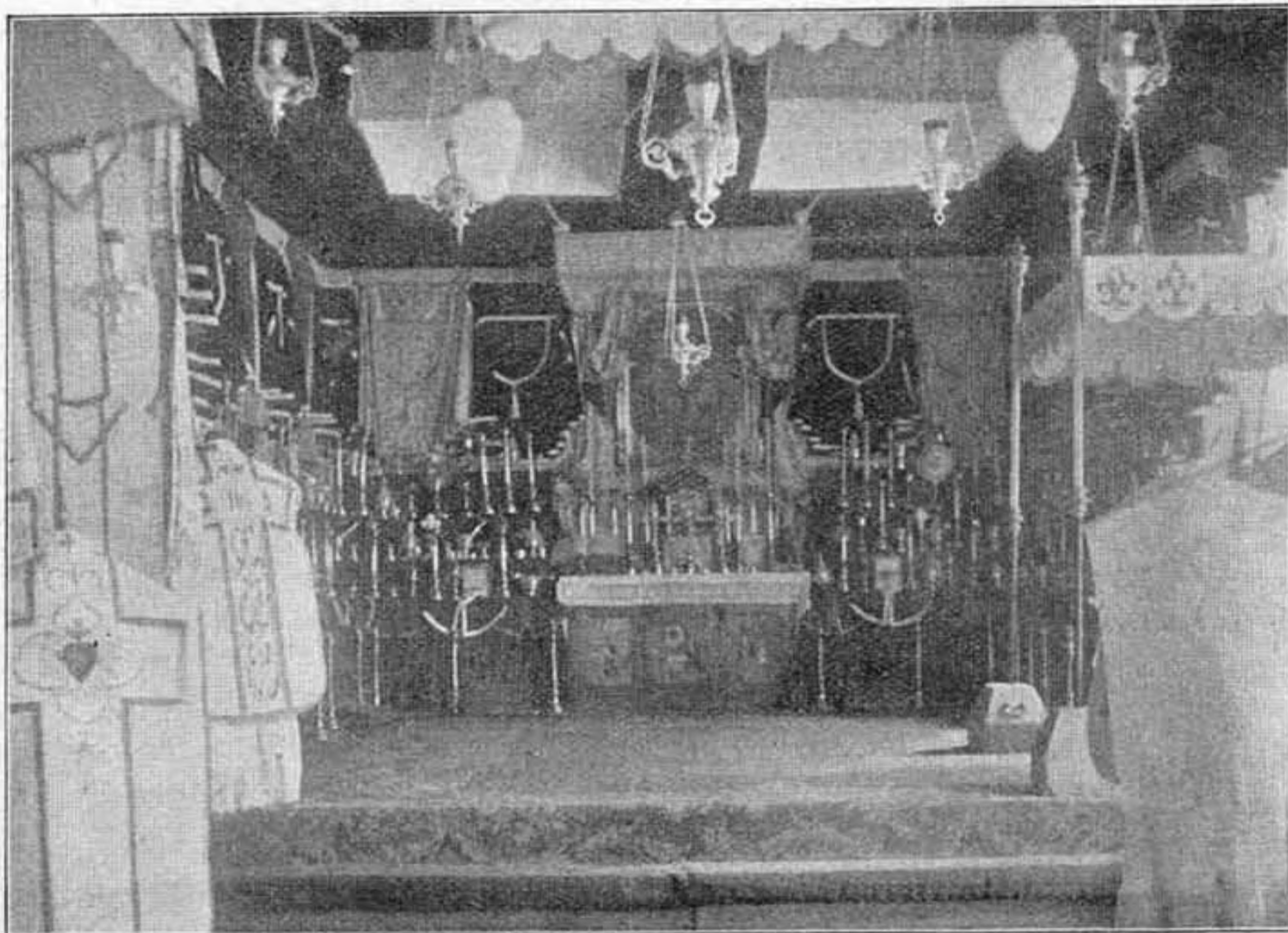
Részlet az Oltáregyesület jubileumi kiállításból.

A veszprémi egyházmegyéből 1902. évben befolyt tagsági díjak: az akai fiok egylet tagjai 34 K, a geszti f. e. t. 7 K, a hidegkuti f. e. t. 10 K, a kis-bári f. e. t. 21 K, a lengyel-tóthi-i f. e. t. 26 K 76 f, a mező-komári f. e. t. 7 K, a nemes-vidi f. e. t. 17 K 16 f, a nemes-dédi f. e. t. 6 K 64 f, a pápa-kovácsi-i f. e. t. 33 K 12 f, a ráksi-i f. e. t. 34 K 96 f, a salamoni f. e. t. 10 K, a sámsoni f. e. t. 12 K 34 f, a topolczai f. e. t. 30 K, a tóth-gyugyi f. e. t. 4 K 32 f, a tóth-szent-páli f. e. t. 8 K 08 f, a sütkevári f. e. t. 20 K, a vörös-berényi f. e. t. 8 K 48 f, a zala-szent-mihályi f. e. t. 26 K 56 f, a zicsi f. e. t. 12 K 24 f, a veszprémi angolkisasszonyok 20 K, ft. Csokonay