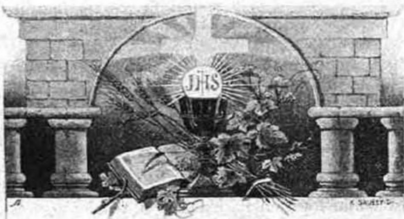
Varga Örökimádás ez. imakönyvéből.