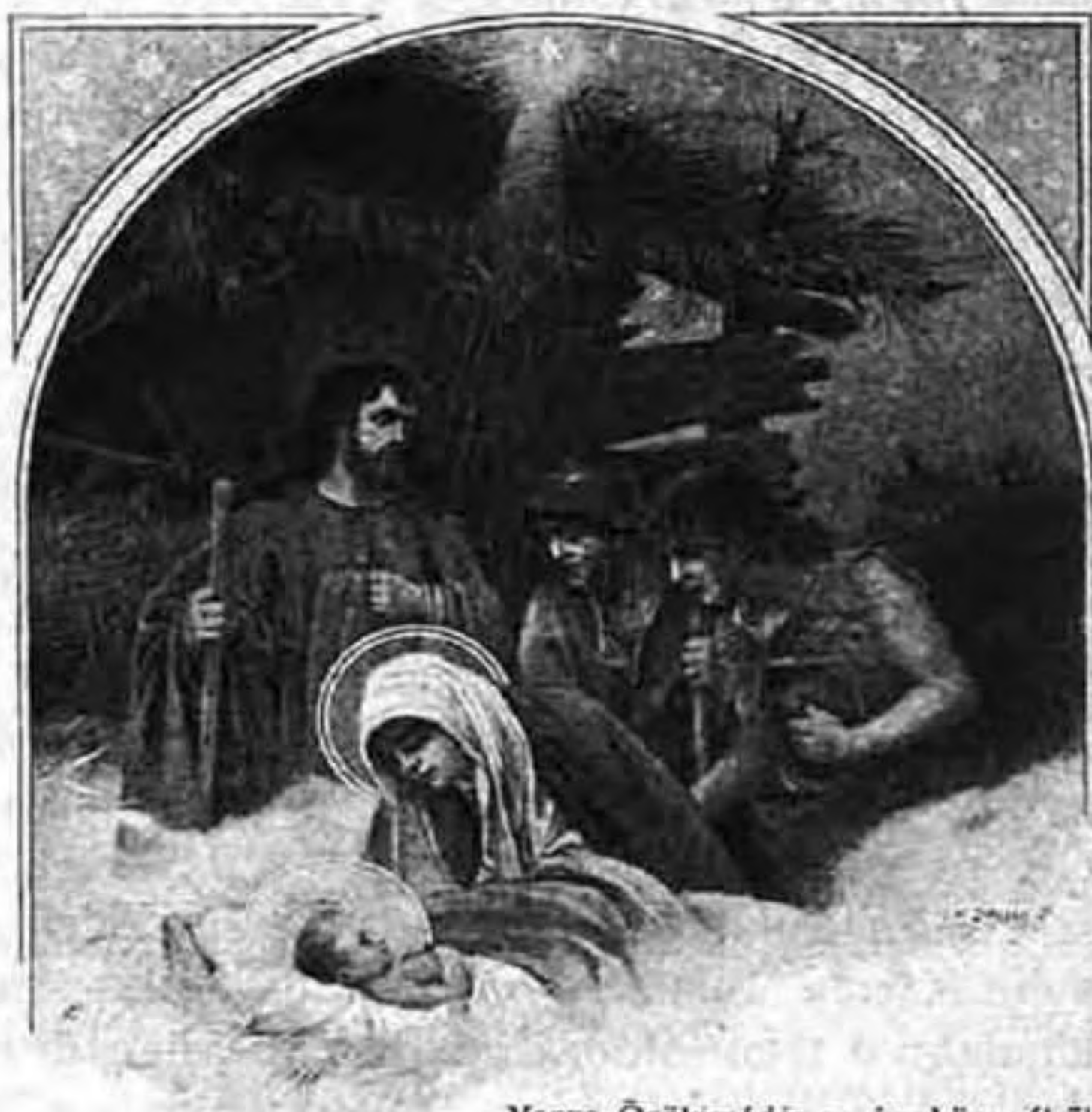
Varga Örökimádás cz. imakönyvéből.

U JÉVRE. Már az ó-esztendő vége felé a különböző nagyságu és tartalmu naptárak teszik a könyvkereskedők boltjainak keresett árucikkét. Napilapok és folyóiratok ilyenkor szintén naptárakat ismertetnek és ajánlanak. Az Örökimádás olvasóinak oly naptár fog e helyen bemutatkozni, mely megjelenésének idejét tekintve, a régmúlt időbe vezet, de tartalom dolgában nagyon is közel esik e folyóirat kitűzött céljához. A Hevenesi Gábor tollából kikerült Calendarium Eucharisticum -ról van szó. Ez a Szentségi Naptár nemcsak a magyar szerzőjü eucharisztikus művek között elsőrendü, hanem a külföldiek között is figyelmet érdemlő. Jeles szerzőnek jeles alkotása ez a könyv. Megjelenésekor sem az volt a célja, hogy az esztendőnek polgári napjairól, az esetleges időjárásról s a csillagászati változásokról adjon fölvilágosítást, hanem, hogy a kenyér színében köztünk jelenlevő Üdvözítőnek imádságát napról-napra fokozza s az Oltáriszentség révén a lelkek tökéletesedését hathatósan előmozdítsa. Ezért a Calendarium Eucharisticum -mal való foglalkozás most is időszerű.