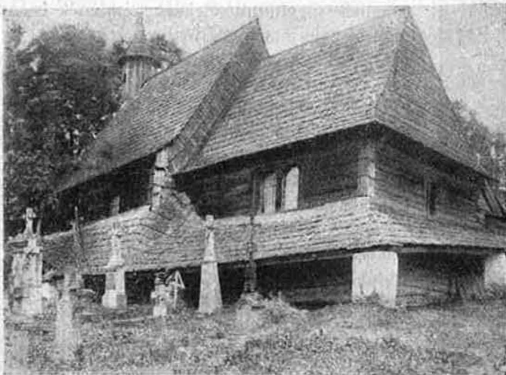
Turdossini fatemplom Árva megyében.

Voltam Rómában, a kereszténység fővárosában. Itt elmentem a régi