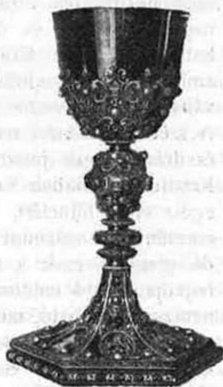
Forgách Ferencz kelyhe a nyitrai székesegyház kincstárában.