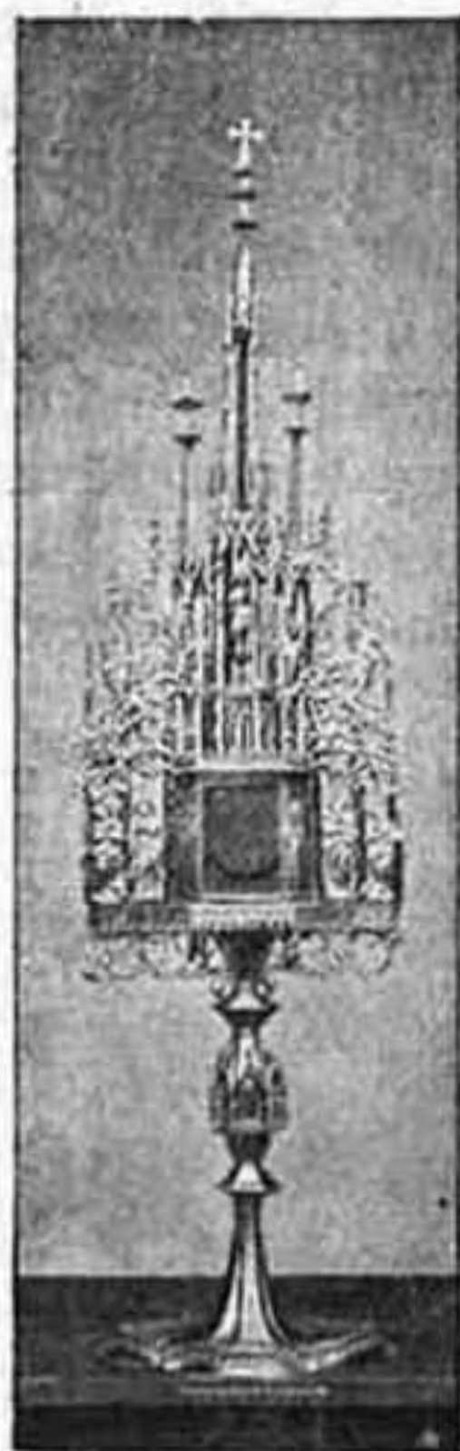
Szentségmutató aranyozott ezüstből (Bajmóczon, Nyitra-megye) 1500 tájáról.

jutottak, e folyón csodálatos módon vezette át az izraelitákat az Ur. Ugyanis Isten parancsolatából a papok a frigyszekrényvel a Jordán vizébe léptek. Erre csodálatos dolgot láttak, mert a hol a frigyszekrényvel beléptek a vízbe, mintha valaki abban az irányban az egyik parttól a másikig egy vonalat húzott volna. Azon vonaltól fölfelé a víz felső folyásában megállt és mozdulatlanul állt, a vonaltól lefelé az alsó folyásban az egész víz lefolyt. A nép száraz lábbal kelhetett át a Jordánon, mert a felső vizek mint szilárd sziklafalak állottak. Az izraeliták megindult lélekkel szemlélték Istennek e csodatevő, nagy hatalmát. Józsue megparancsolta, hogy hozzanak magukkal a Jordánból 12 nagy követ. Megtették. Átkeltek mindnyájan. — Ekkor a Jordánnak eddig mozdulatlanul állt felső vizei megindultak és tovább folytak lefelé, mintha mi sem történt volna. Józsue pedig a 12 nagy követ a parton emlékjel alakjában föllállította és így szólt a zsidókhöz: Helyezzétek ide annak emlékjelül, a mit most láttatok. És majd, ha unokáitok azt kérdezik