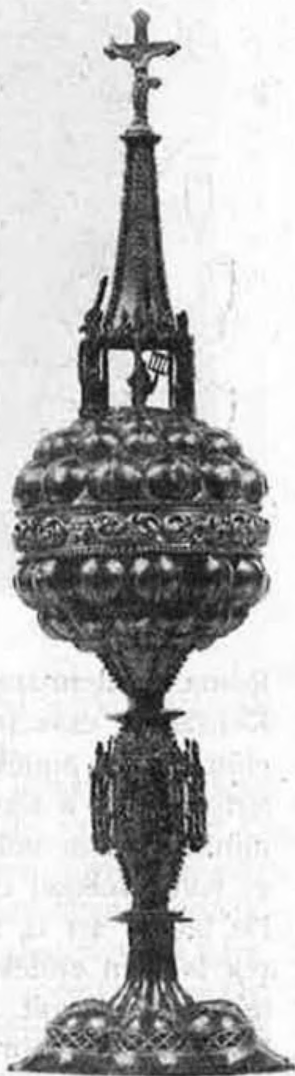
A pásztói templom áldoztató kelyhe (Hévesmegye).

Hogy ily könnyen felednek az emberek, e föltevésében nem tévedhetek. Erről bizonyosságot tesznek előttem maguk az emberek, mert hiszen ha azt akarják, hogy nagy embereiket: hőseiket, költőiket, tudósait, nagy királyaikat el ne feledhessék, szobrokat állítanak nekik, piramisokat, obeliszkeket, emlékoszlopokat emelnek számukra, emléképületeket építenek nevüknek,