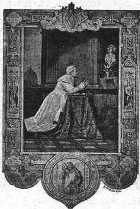
IX. Pius, az Oltáriszentség pápája, az isteni szív imádjója.

mindig, látszott rajta, hogy gyenge, de szívós türelme, jóságos lelke leküzdötte a test gyengeségét. Mindenki érezte, hogy Jézus szive dobog benne, Jézus szól hozzájuk, mikor ő beszél. Szelid volt és erős, mint Jézus szive az Oltárokon. Első áldozása óta mindig Jézus szívéhez imádkozott, vajmi sokszor látták őt térdelni az isteni szív képe előtt. Ma épen boldog napja volt. Hetvenöt évvel ezelőtt, 1803. február 2-án járult mint kis