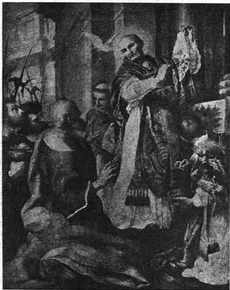
Szent Gergely pápa hit hirdetőket küld az angyali kenyérrel az angol nép közé.

a nyugati egyházban a régi egyházatyák, kiknek tanítását úgy hit, mint erkölcs dolgában a mi testvéri gyülekezetünk régi idő óta mérvadónak tartja, néki mindig tulajdonítottak.