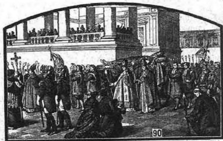
IX. Pius temetése.