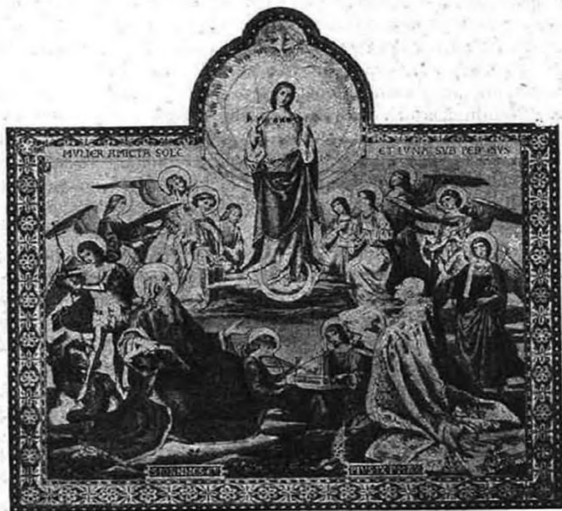
Az Oltáriszentség nagyasszonya a Szeplőtelen Fogantatás. IX. Pius siremlékéről. A képen balról Szent János apostol, jobbról IX. Pius pápa.

tatni az embereket az Isten új csodájához, az Oltáriszentséghez, melyet csak az örök szeretet találhatott ki. Mária úgyszólván ott lakott az oltár lábainál, az Úrvacsora asztalánál, hol Jézus szeretete mintegy ott felelte magát az emberek között. Mária nemcsak egyedül volt itt, vele együtt Jeruzsálem leányai imádták az Isteni szeretet csodáját. A esoda egészen új volt, az első szentségimádás is úgyszólván csupa bámulat volt.