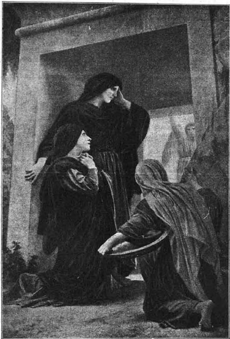
Nincs itt! Föltámadott!