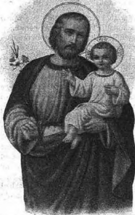
Szent József, az áldozók pártfogója. Pártfogásának ünnepe husvét utáni harmadik vasárnapon van.

Bizony, bizony mondom nektek, egy ma közületek elárul engem. Sohasem felejttem el a következő történetet. Egy faluban, a hol káplánkodtam, azon szokás divott, hogy az ifjúság utczánkint beosztott csoportokban végezte husvétii szent áldozását. Egyik husvét után harmadik vasárnap több oly