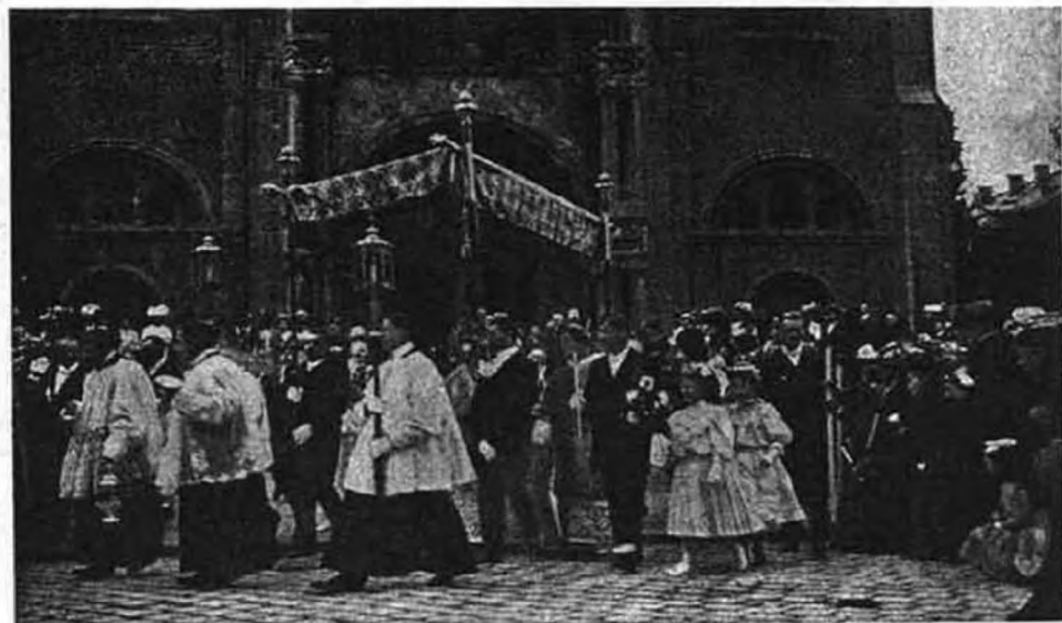
Úrnapi körmenet a bajor fővárosban.

Nemes versenyre kelnek a katolikus Egyházhoz, ehhez a közös anyához, hú nemzetek, hogy minél ünnepélyesebbé, lélekemelőbbé tegyék