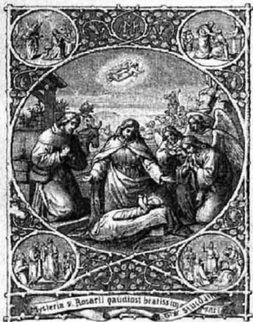
Az örvendetes rózsafüzér.

A ny...i egyházmegyéből is ott állott az oltár előtt egy levita, hogy fölvegye a püspök-bíboros kezéből az egyházi rend szentségét. Miként nálunk, úgy ott is a hívek sorai közt található a fölszentelendők rokonai; de a mi levitánknak bizony nincsen ott senkje. Ugyan ki is jönne oda a messze hazából, a hazának Trencsén vármegyéjéből.