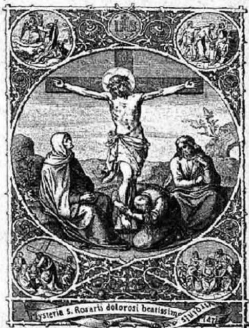
A fájdalmas rózsaszaffér.

Siri csendben csak az imádkozó ajkak suttogása volt hallható. És az emlékezésnél két könnyesepp gördült alá a miséző arcán! Ugyan ki juthatott eszébe? Bizonyosan a távol magyar hazában levő övéi, akik nem lehettek tanúi örömeinek. És azért mégis mennyi vigasztalás, mennyi öröm jutott neki azok részéről, akik ezt a napot oly emlékezetessé tették a szeretet gyengéd figyelmével. Hazajövet reggelig várta az ünneplőket: majd öröm és sejtések között tartottak szobáikba. Ami primiciánsunk a hatodik emeletre igyekezett, mert ott volt szobája. Úgy gondolta, hogy akiknek itt vannak a rokonaik, azoknak az ajándékokból bőven jut ki, de neki már az is kedves ajándék volt, amit megjelenésükkel nyújtottak az ismerősök. De mekkora meglepetés éri, midőn szobájába ér! Föl volt diszítve. Térdeplője pirossal bevonva, azon szent István emlék-reliquiája két gyertya között. Majd az asztalra tekint, melyen sok ajándék-könyvet