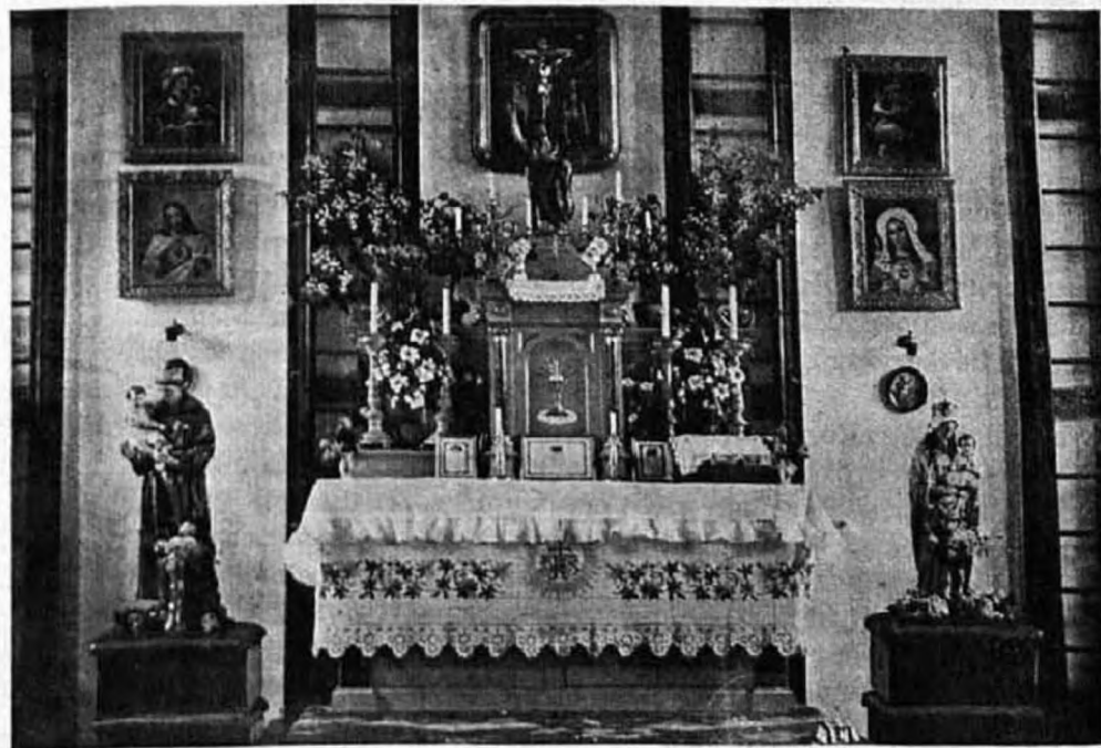
Oltár a budapesti Soroksári-úti iskola tornatermében.