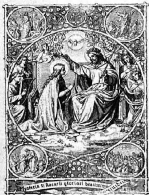
A dicsőséges rózsafüzér.