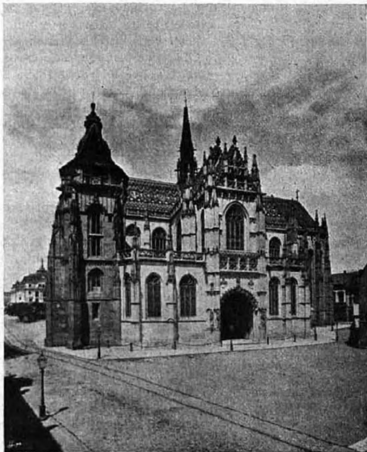
A kassai Szent Erzsébet székesegyház.

városban állomásozó Pálffy Lipót-ezred kivezényelt legénységének dísz-tüze emelte az ünnepi hangulatot. A megnyitó ünnepségre már a társulat költségén szereztetett be egy kisebbfajta mennyezeternyő meg két remek kivitelű templomi zászló, továbbá egynémely egyházi szerelvény. Az egyik zászló feketeszínű volt, másika pedig piros; utóbbi a legtinomabb