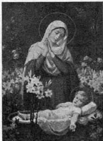
Az első imaóra.

öltözött ministráns gyermek forgolódott az oltár körül. 12 bihorba, 12 világoskék selyembe volt öltözve. Kivágott cipő, hosszú piros, illetve fehér harisnya volt a lábukon. Az arany- és ezüstsujtású bugyogó térden felül kezdődött. Az aransujtással díszített, rövid ujjú bő kabátjuk alól fehér selyem felsőruha tűnt elő. Finom szőke, vagy fekete paróka omlott le vállukra. Piros, illetve fehér selyem keztyű volt a kezükön. A 25-ik pedig a violaszin bársonyba, spanyol díszbe volt öltözve. Parókáján kék- és fehérszínű lapos kalap volt. Ez a püspök uszályát tartotta, mindig körülötte forgolódott, csókolni való kedvességgel. Mintha imádkozó kis kolibrik lennének. Lesütött szemmel, imára kulcsolt kézzel álltak, ültek vagy térdeltek, ahogy a szertartás következett. Sanctuskor tetőtől-talpig hófehérbe öltözött, fehér selyem cipőjű ministránsok jöttek elő párosával, gyertyákat tartva kezükben