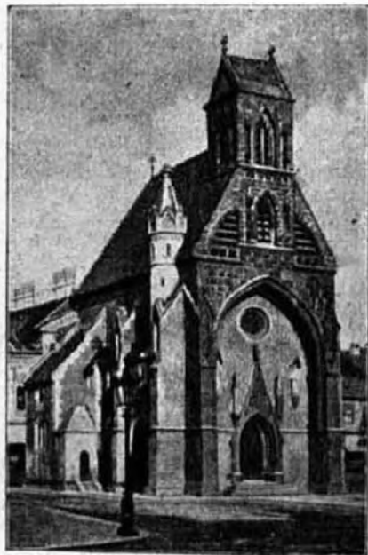
Szent Mihály kápolna Kassán.

A társulat zavartalanul működött egészen 1782-ig, midőn a jozefinizmus hullámai elsöpörték ezt a társulatot is, miként a hitbuzgalmi egyleteket egyáltalában. Midőn a mult század hatvanas éveiben az oltáregyesületi eszme nálunk is mindjobban gyökeret vert, kísérletet tettek a régi kassai Oltáregyesület fölélesztésére is. Új tagokat is vettek föl 1868., 1875., 1876., 1878. években. Mindazonáltal elmondhatjuk, hogy ma már csak emléke él a régi kassai Oltáregyesületnek. Emlékét fönn tartják az egyletnek ráánkmaradt albuma s az elvéve található fölvételi cédulák; mindakettő a társulat alapítása évéből, 1758-ból.