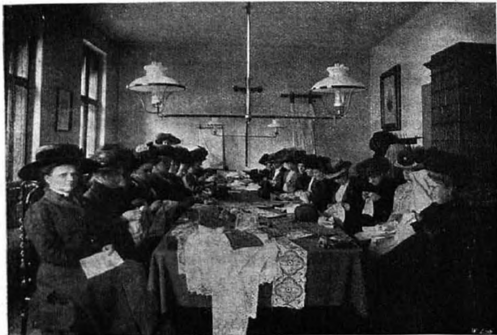
Munkaóra a központi Oltáregyesületben.

Csakhogy a portugál duda egész más dallamra szól, mint a bethlehemi pásztorok szívreható, mélabús danája. A szerzetesekre a hazugságot ráfogták, hogy bombákat dobtak, azért öldösték őket. De hogy az ostyában szunnyadó isteni gyermek mit vételt a portugál nemzetnek, azt ők maguk sem tudnák megmondani. Heródesi féltékenység és lelkiismeretfurdalás kellett tehát ahhoz, hogy a bethlehemi kiscédhez hasonló csendes ostyát bántalmazták. Ime napjaink evangéliumának heródesi rémtettei: egy portugál napilapból vettük az alábbi sorokat.