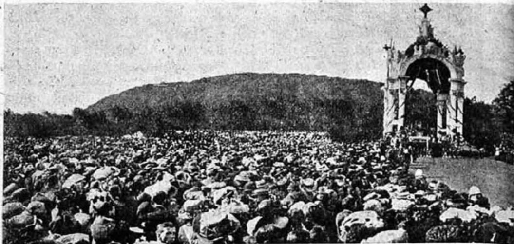
A montreali eucharisztikus kongresszus fénypontja. Vanutell

szentelt püspök és csak szentmise közben végezheti, rendszeren a püspöki székhelyeken mennek végbe és így a hívőknek nagyrésze meg van fosztva attól, hogy ezeken a régi, megható szertartásokon résztvehessen. Ennél fogva nem lesz fölösleges, ha a következőkben az áldozópapok fölszentelésének szertartásait fogjuk ismertetni, amiként azokat a püspök a pontificale romanum* előírása szerint végzi. Ezzel szolgálatot kívánunk tenni nemcsak azoknak, akiknek nem volt még alkalmuk látni papszentelést, hogy azt részletesen megismerhessék, hanem egyúttal azoknak is, akik