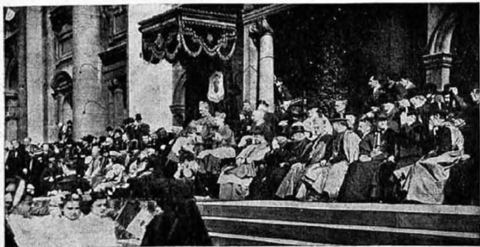
Vanutelli bíboros pápai követ az amerikai gyermekek hódoló diszfelvonulását fogadja.

— Ön nagyon rossz képet választott, hogy az igazságot szemléltesse. A dió t. i. nem életszükséglet, az igazság azonban az. Azért inkább a