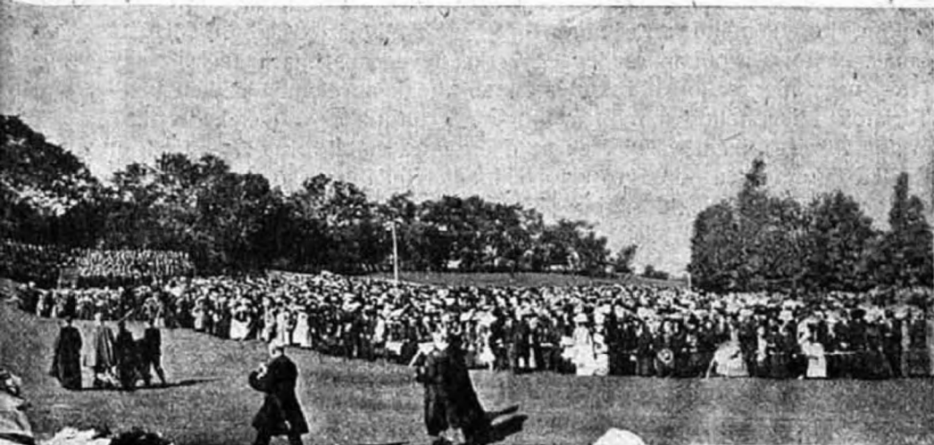
ps. ünnepi misét mond a szabadban a Mont-Royal hegy tetején.

Majd a püspök titkára vagy a jelenlevő papok egyike fölolvassa a fölszentelendők névsorát, mindenik nevével kijelentve, hogy mily címen fog fölszenteltetni, vagyis hogy mely forrásokból fogja nyerni ellátását. A világi papokat nálunk rendszeren az egyházmegye címére (ad titulum dioecesis) szentelik föl, míg a szerzeteseket az általuk fogadott szegénység