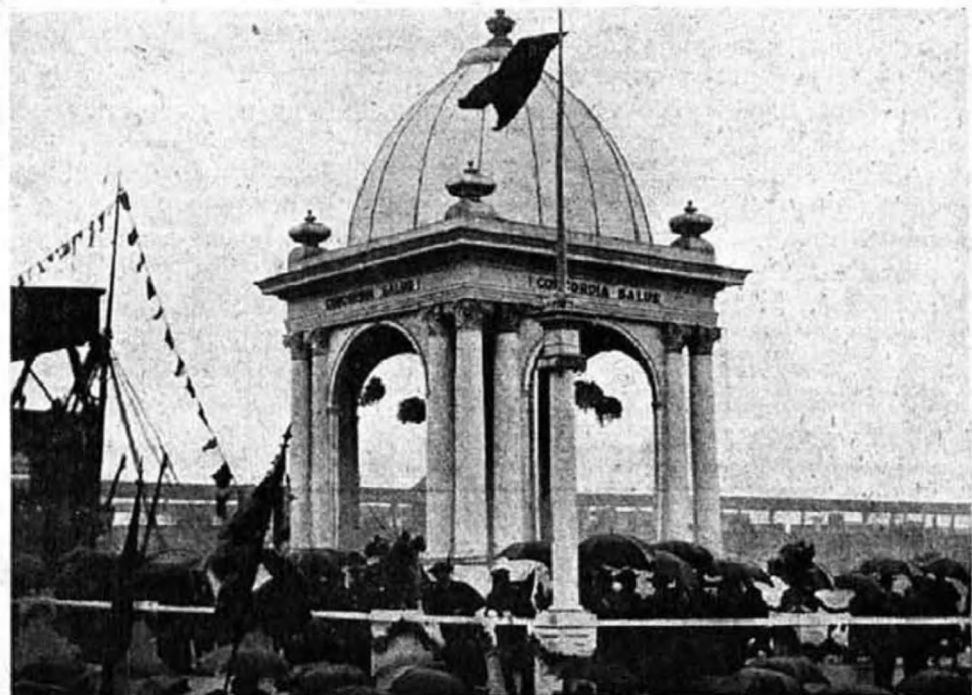
A pápai követ fogadása Amerikában. A diadalkapu.

Talán feltűnt neked k. hívő, hogy a Szentatya nem szól semmit a gyónásról . Ez azért van, mert a gyónás még a mindennapi áldozáshoz