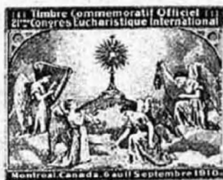
A kanadai világkongresszus emlékbélyegei.

megtörni — úgymond — annak a férfiúnak jellemét, aki mindennap buzgón imádkozik.