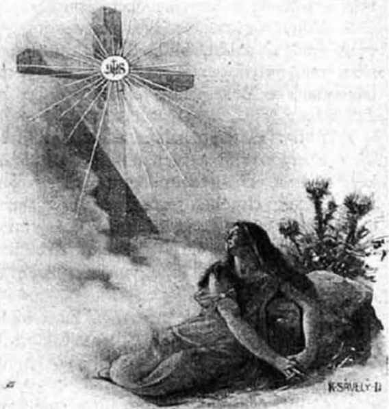
A keresztfához megyek.

Ez Floers kisasszony, aki nemcsak ráksebéből, hanem előrehaladt tüdőbajából is kigyógyult.