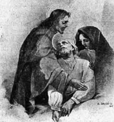
Szent József halála.

vezetők jelvényével. E jelvény mindenütt utat nyitott nekem úgy az urak, mint a nép közt. Ily szíjakkal fölszerelve jelentem meg 1882. évi szeptember 1-én korán reggel a lourdesi vasuti állomáson. Várták a belgiumi betegszállító vonatot. Ezer belgiumi zarándoknak kellett érkezni, akik 50 beteget hoztak magukkal. Szegények! ugyan össze lehettek törődve a háromnapos út után; mert ennyi időt töltöttek az uton, míg a Franciaország tetején elterülő Belgiumból Délfranciaország legdélibb határához eljutottak. Mert Lourdes már a Spanyol határon van, a pyrenei hegyek tövében. —