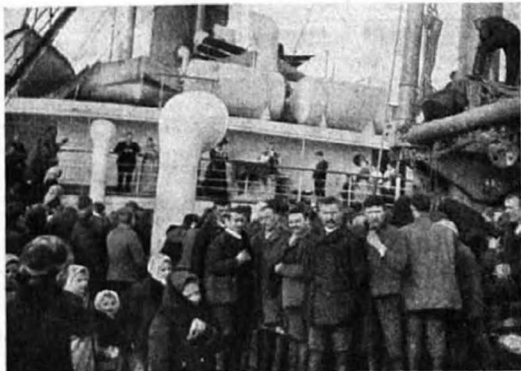
Áldozás a hajón.

B EDAU francia tábornok egyike azoknak a hősöknek, kik Franciaország részére meghódították az afrikai gyarmatokat. Egyik ilyen hódító expedíció előtt történt, hogy a tábornok harcba induló seregével egy pappal találkozott. Bedau megállítatja a katonákat, leugrik lováról és a papot arra kéri, hogy gyóntassa meg. A gyónás végével aztán katonái felé fordul s így szól: