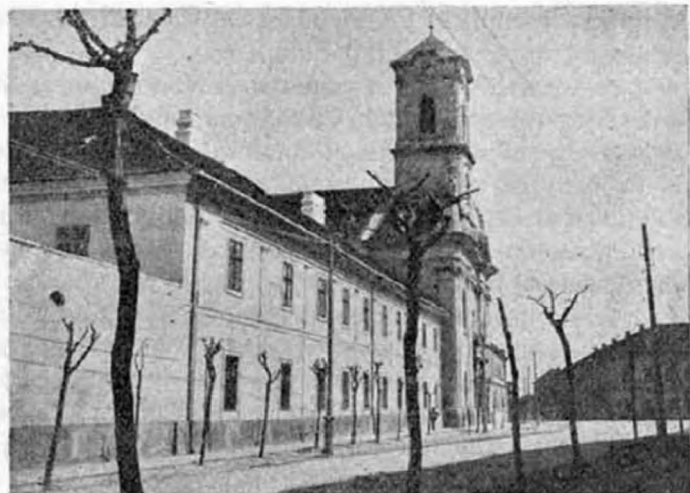
Kegyesrendiek kecskeméti temploma.