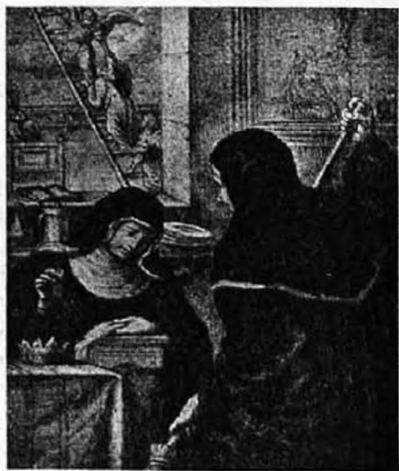
Boldog Gizella, az Oltáriszentség dicsőségén fáradozik.

Óh dicsőséges Jézusom! végtelen hála neked, hogy a szent áldozásban hozzánk jönni méltóztatol. Dicsérjenek és magasztaljanak az ég minden szentei; végtelen jószágod és szereteted maga is dicsérjen és magasztaljon, melynél fogva te mint szelid Király jössz sziveinkbe! De, ó Jézusom! mily szegény az ország, melybe a szent áldozás alkalmával bevonuláson tartod!