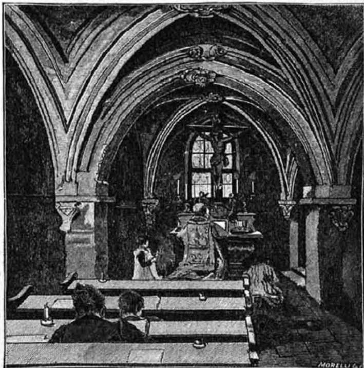
A veszprémi Gizella-kápolna. Szent István király nejének s a magyar oltáregyesületek védasszonyának, Boldog Gizellának szentelve.

a hívek közössége épüljön és terjedjen. De van még más módja is a női nemnek ahhoz, hogy az oltáráldozatból kivegye a maga részét. A dicső emlékü XIII. Leó pápa egy allokúcióban, melyet az örökimádásról nevezett szerzetes nőkhöz és világi munkatársaikhoz intézett, azt mondja, hogy a szent öltözetek készítésére fordított női munkában a női nemnek csodálatos fölmagasztalása nyilatkozik meg. A női nem ezen szolgálatával mintegy részt vesz az újszövetség papságának méltóságában, amely papság magát az Isten Fiát mutatja be a szent misében, az Oltáriszentségben az Atyának hasonlíthatatlan áldozatul. «Igen, kedves leányaim, úgymond, a boldog emlékü pápa,