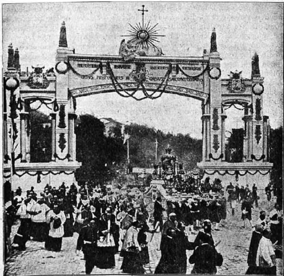
Az Oltáriszentség diadalútja Madridban.

mára, amely négy hatalmas keréken jár. Ezt történelmi ruhákba öltözött templomszolgák húzták és tolták. Ezt a custodiát még egy nyolc ló által vont gyönyörű dízkocsi is kíséri, amelyben senki sem foglal helyet, kizáró-