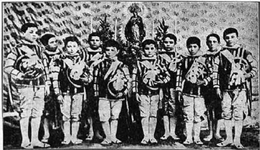
Ezek azok a sevillai táncosfiúk, akik az Oltáriszentséget lelkes táncukkal dicsőítik.

Érted-e, gyermekekem? Szent János a kereszt lábánál az egész emberi nemet képviselte és a haldokló Jézus Máriára mutatva, neked ép úgy, mint minden embernek mondja: «Ime a te anyád!» Valóban, lehetséges, hogy az Isten fiának anyja igazán a te anyád is legyen? Igen, gyermekekem, ez lehetséges, mert Jézus így akarja. Szűz Mária a te anyád és anyai hivatását, melyet isteni Fia bízott reá hiven teljesíti. Kiterjeszti reád anyai gondoskodását, mint egykor Fiára. Úgy szeret téged, mint Őt szeretete. Te kedves gyermeke vagy és a legodaadóbb édesanya gyöngédségével és szeretetével öröklik mindig feletted.