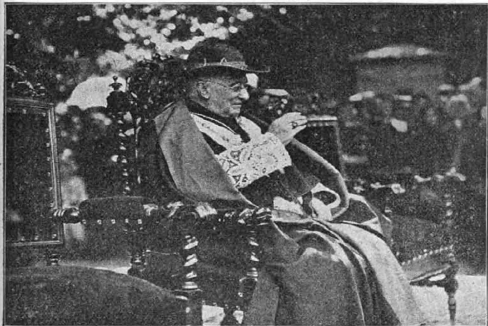
Aguirre biboros pápai követ.

mus és a vallástalanság ellen folytatott. Utána az egyetlen jelentkező portugaliai főpap, a bejai püspök emelt szót és röviden megemlékezve a portugaliai állapotokról azt fejtegette, hogy a mindennapi áldozás lesz a népek megmentője. Majd a lugo-i püspök beszélt, akinek székvárosát a spanyolok az eucharistia városának nevezik, mert székesegyházában az Oltáriszentség éjjel-nappal állandóan ki van téve imáadásra. Ezután de Mun gróf munkatársa, Pouttaint, a párisi főtörvényszék ügyésze fejtegette az Oltáriszentség szociális hatásait. Az ülés utolsó szónoka is világi ember volt, Pidal márki