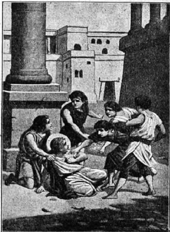
Tarzicius, az Oltáriszentséget vivő gyermek, a madridi szentségi kongresszus védője.