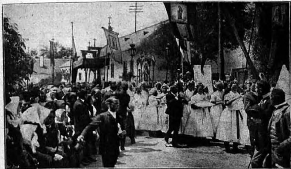
Engesztelő körmenet Barstaszaron.

ságot, melyre az emberiség lelki vágyódása irányul, nem adja meg, még kevésbé találhatja azokban a keresztyény lélek boldogságát. A keresztyény lélek, mely a hit igazságait felvette magába s ezzel bepillantást nyert a világ mulandóságába, tisztában van azzal, hogy a valódi boldogság csak az Isten megismerésében és szeretetében, csak az Isten birtokában állhat. Csak az Isten elég gazdag ahhoz, hogy a keresztyény lélek boldogság utáni vágyát kielégíthesse, csak az Isten változhatlan s nem hagyja el a lelket, mely magát neki adta. Ha tehát felgondoljuk, hogy az Oltáriszentség bennünket Krisztussal a legbensőbbben egyesít, Krisztusban pedig az istenség