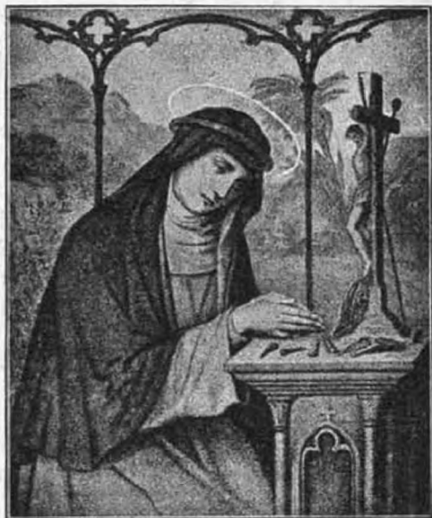
Limai szent Róza.

Eltemetik szive vőlegényét, szüzi lelke Jegyesét s ő nem vár a harmadnapi feltámadásra, hanem a kert déli részébe zárandokal át zokogó bána-