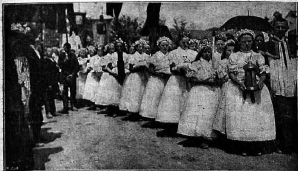
Engesztelő körmenet Barstaszáron.

hogy egy olyan hitközségben, mely közel 7000 lelket számlál, oly vallás keretében, mely az Oltáriszentséget központba állítja: ha megalakul egy bemondottan Euch. egyesület, annak egy évi fennállása után is csak 200 tagja van. Ez tünet!... mely mellett gondolat, érzés és megjegyzés nélkül nem szabad elmenni. Itt van — természetesen a kaszinó — nem mozgat akkora célokat, nagy tagsági díjakat szed — és van hárommannyi tagja. Itt a tények beszélnek: a városban, a hitközség általánosságában nincs kath. szellem! Itt jog szerint a plébános 7000 kath.-nak plébánosa, de hánynak, hány hívőnek vajjon a lelkipásztora, hánynak tör kenyeret?