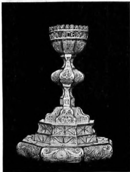
X. Pius pápa ajándéka.