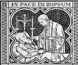
DORMIAM ET REQUIESCAM