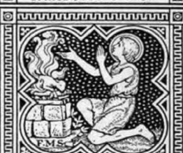
PARCE POPULO TUO.