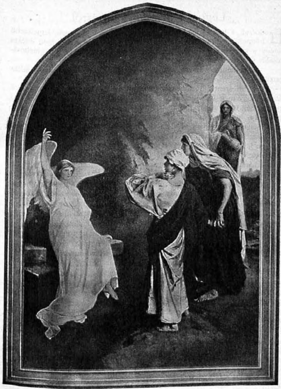
Feltámadt . . .