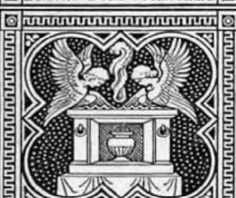
ET TURTUR NIDUM ALTARIA.