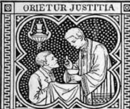
ET ABUNDANTIA PACIS.