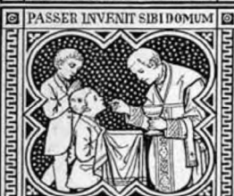
ETTURTUR NIDUM ALTARIA.