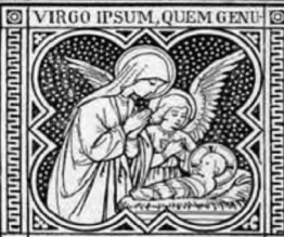
IT DEUM ADORAVIT.