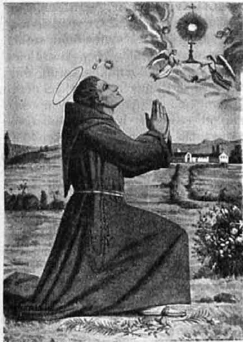
Baylon szent Paszkál.

S ZENT PASZKÁL az eucharisztikus egyesületek patronusa. XIII. Leó pápa, amint Aquinoi szent Tamást a tanuló ifjúság, Depaul szent Vincét a keresztény szeretet művei, Lelli szent Kamilt és Istenes szent Jánost a betegek és a beteg ápoló rendek patronusává tette, úgy akart az összes oltáregyesületeknek és szentségi társulatoknak is pártfogót adni.