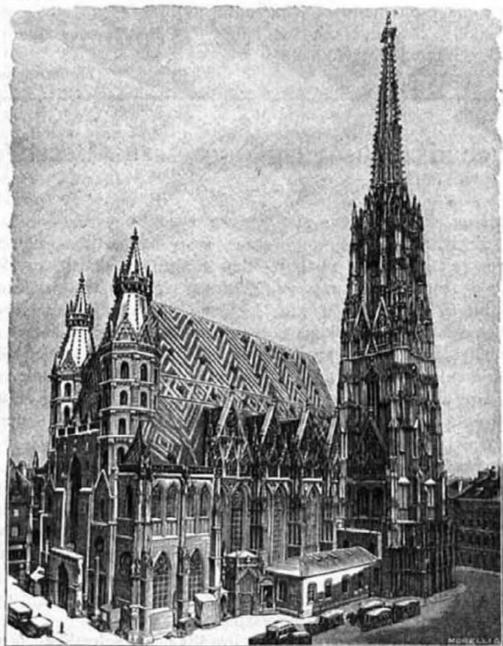
Szent István-dóm. A bécsi euch. világkongresszus színhelye.

Az 1912-ik évre az eucharisztikus világkongresszus színhelyéül Bécs városa lett kiszemelve. Első eset, hogy az osztrák és magyar monarchia határain belül euch. világkongresszus folyik. Ép azért a monarchia min-