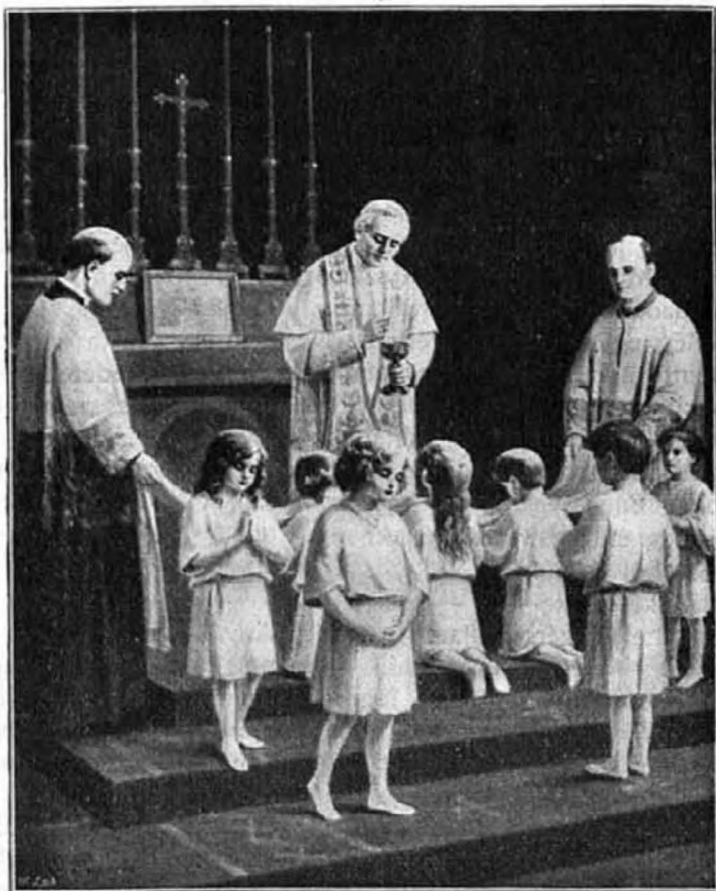
Őszentsége X. Pius pápa gyermekeket áldoztat.

azért nőnek most, mert melegebben süt a nap. Mikor pedig valaki a szent áldozásban magához veszi az Úr Jézust, akkor az Úr Jézus szent gondolatokat sugár nekik és jócselekedetekre bírja. A mi szent gondolataink