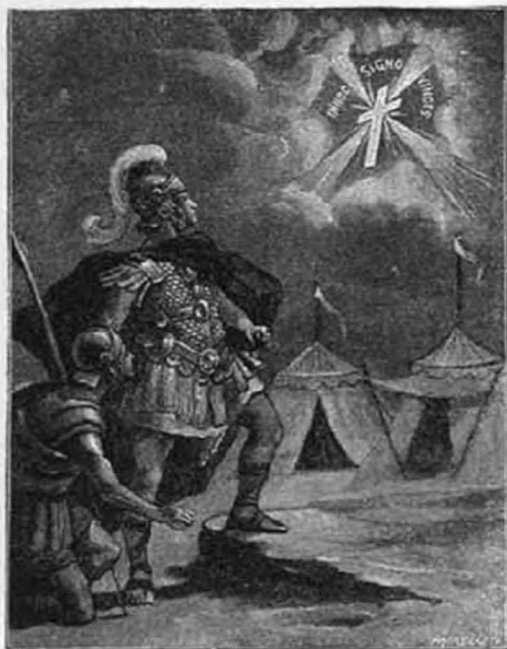
Konstantin császárnak megjelenik a kereszt jele.

Új vallás volt a kereszténység, melyre minden fennálló pogány szekta és elsősorban a zsidóság részéről a jövevényeknek kijáró, lenéző és megvető tekintet esett. Nemcsak jog nélkül szűkölködött, hanem az egész művelt világot átéléző római birodalom alaptörvényeibe ütközött és a jogrend államellenesnek minősítette, ami által létében volt a kereszténység megtámadva.