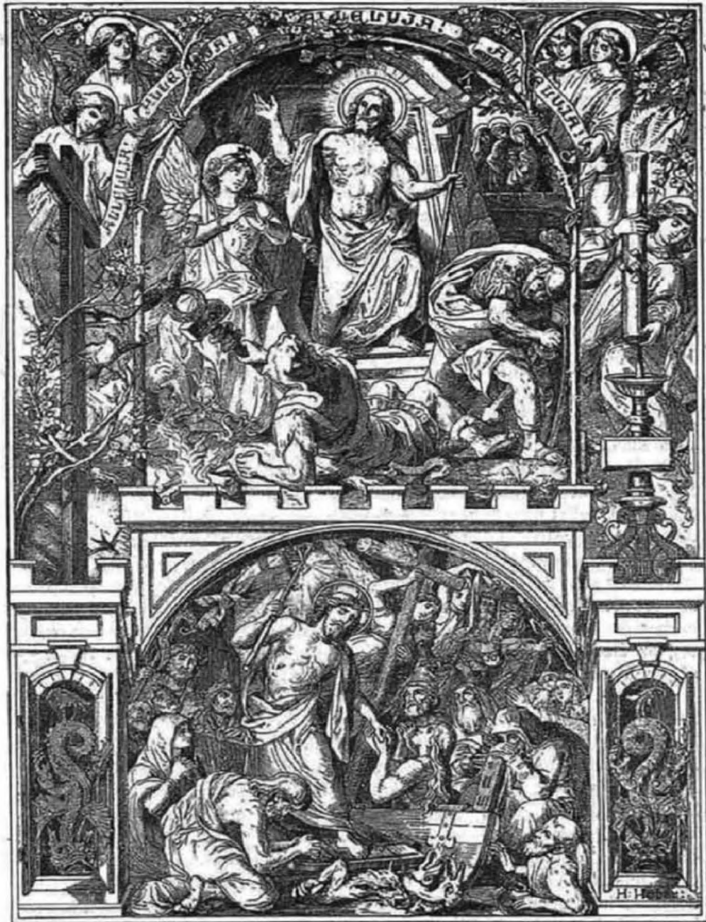
A mi Urunk feltámadása.