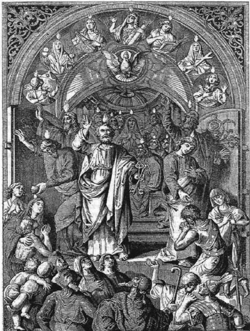
A Szentlelek Isten eljövetele.