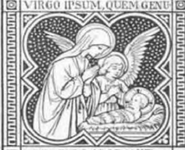
IT DEUM ADORAVIT