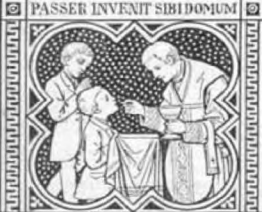
ETTURTUR NIDUM ALTARIA