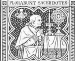
PARCE POPULO TUO.