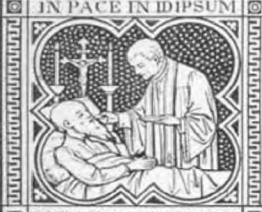
DORMIAM ET REQUIESCAM