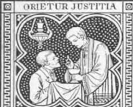
ET ABUNDANTIA PACIS