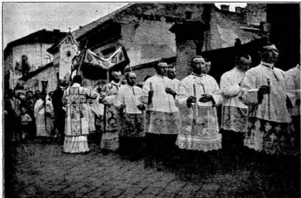
A budapesti Oltáregyesület szentségi körmenetéből.

Ez volt azután egyetlen örömük, egyetlen vigaszuk. Ha akadt olyan pogány, aki szívébe fogadta az édes Jézus tanítását és odaállt a szent keresztvíz alá, akkor minden szenvedést elfelejtettek.