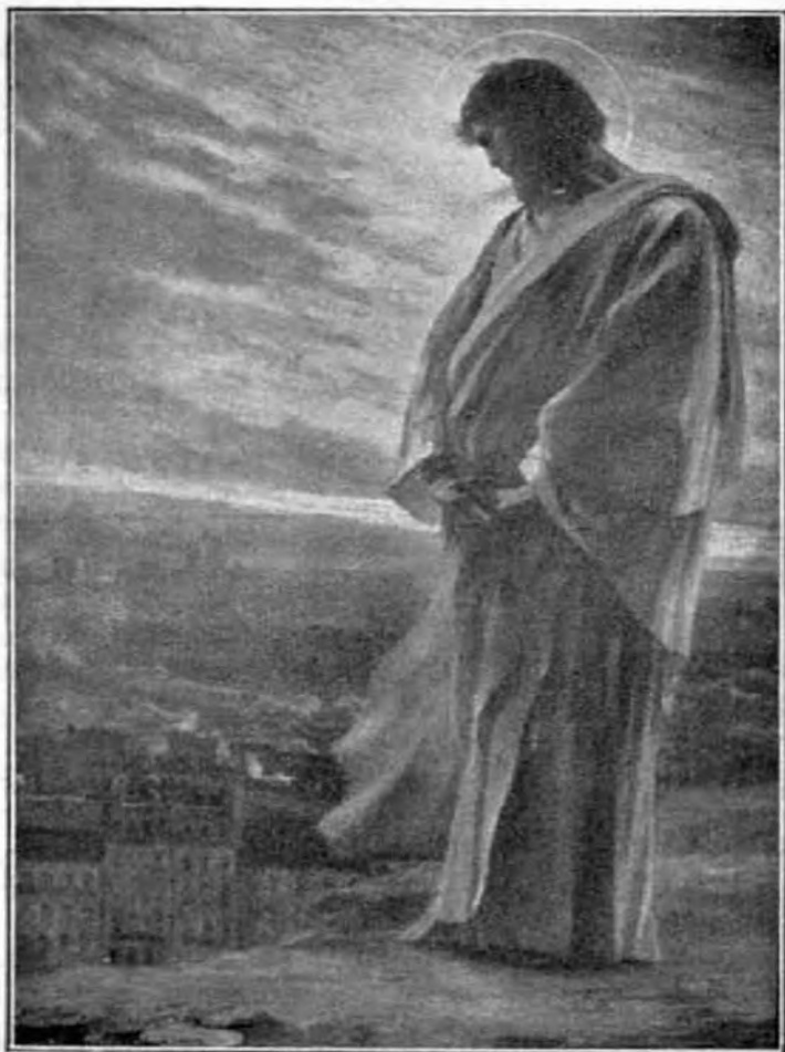
«Sírán sír éjjel és az ő könnyei az ő arcán...»

Nyögnek a földek, mert nemzet kelt nemzetre és ország ország ellen. Kiöntötték a tüzet és nagyobb lett ágyúik dörgése, mint a tenger moraja az ő haragjának napján.