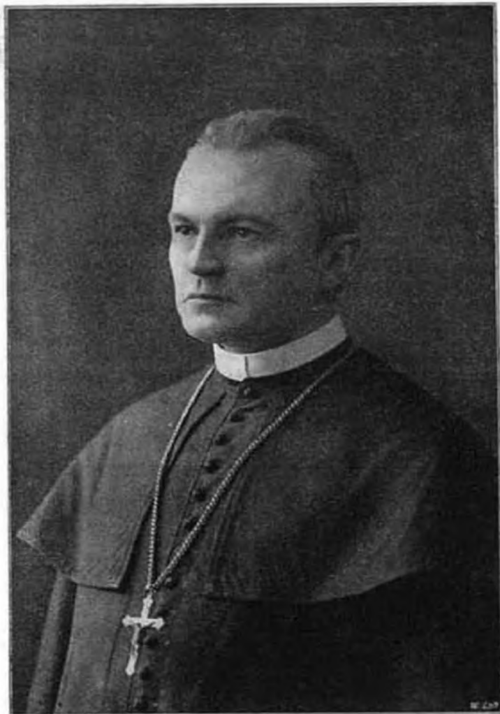
Prohászka Ottokár, székesfehérvári püspök.

És mi tanúi vagyunk mindezeknek, melyeket cselekedett magyarok vidékein és az ő városaikban, elkezdve a hegyektől egész a tengerig.