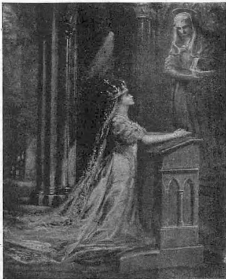
Zita királyné imádkozik.

azt mutatja, hogy a mai modern ember nemcsak gondolkodásában, hanem érzésében is inkább a rosszra hajlik. Ha ilyen viszonyok mellett az emberies érzés hangoztatását halljuk, az a legnagyobb képmutatás. A cseléd nem idegen a házban, hanem családtag, kit szeretettel, aggóató félté-