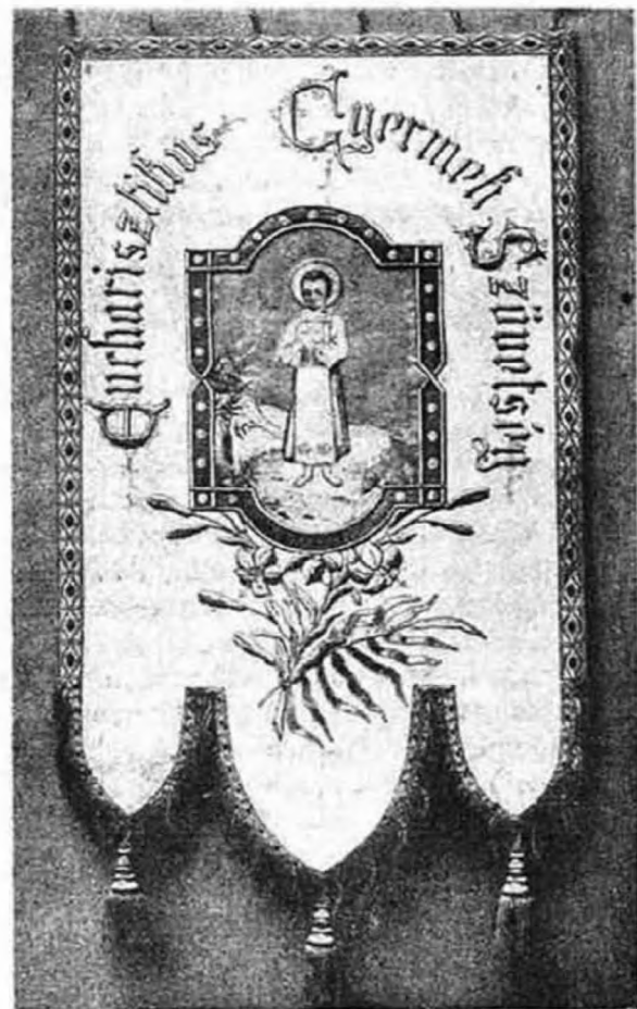
A bud. euch. Gyermekszövetség zászlaja.

háznak. Az Egyház a továbbélő misztikus Krisztus. Tehát nem választható el Krisztustól, aki a feje, éltetője és lelke. Neki nem elég a történeti Krisztus, aki valaha élt, sem az a Krisztus, aki néhanapján leszáll hozzá: neki Krisztus kell, aki benne, vele állandóan és mindig él. Ez az