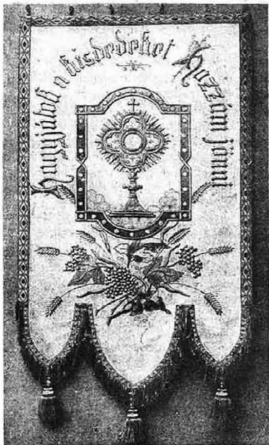
A zászló másik oldala.

Ad consolationem... hic habitat caritas aeterna! Mit jelent ez most, különösen a világháború véres napjaiban. Lakása az a tabernákulum a legfölségesebb Istennek, a népek és nemzetek sorsát intéző legfőbb