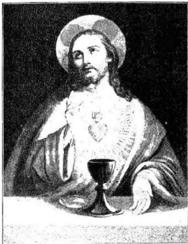
„Jézus eucharisztikus Szíve, irgalmazz nekünk.» 300 n. b.

érzi: folytatnia kell méltatlan lantján a fehér virág bensőséges, kicsi dalait. De, hogy ezt tehesse: jónak is kellene lennie — gyermekinek és minden áldozatra késznek — amilyen te voltál!