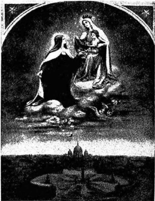
A Kis Teréz szenttéavatási festménye.

ostya színei alatt ugyanaz az Úr Jézus rejlik, mint aki mint örök Ige mindeneket teremtett, egyetlen egy «legyen!» szavával a semmiből előhívott. Ha csak kissé is körülnézünk a minket környező természetben, mely az egész mindenségnek csak nagyon kicsi része, máris a legnagyobb tisztelettel, istenfélelemmel kell, hogy elteljünk a Teremtő iránt. Micsoda mérhellen tömegek, távolságok és erők működnek fölöttünk, alattunk és körülöttünk! A nap 20 millió mértföldnyire van tőlünk. Ha egy kilőtt ágyúgolyó egyenletes sebességgel haladna feléje, csaknem 26 évig kellene repülnie, míg a napba érne. Époly csodálatos az ásvány-, növény- és állatvilág itt körülöttünk. Nincs emberi művészkéz, mely oly tökéletesen tudna egy kristályt kicsiszolni, mint ahogyan ezt az ásványvilágban minden utcai kavicsnak kristályain látjuk. Nincs művészkéz, mely oly tökéletes virágot tudna faragni vagy összeállítani, mint amilyen az útmenti árokban is megnő, az élettől s illattól el is tekintve egészen. És az állatvilágban mennyi miriádnyi lény, mit csak éles nagyítókkal vagyunk képesek észrevenni. S mindez fenséges összhangban egymással, egymást tisztító erők, melyek mégis harmóniát hoznak létre. Ó én értem a nagy természettudósokat, mint Tycho Brahe, Kopernikus, Newton, Volta stb., hogy mind hívő emberek voltak. Ámde csodák csodája: ez a teremtő, mindenható örök Ige, aki megtestesült az idők teljességében