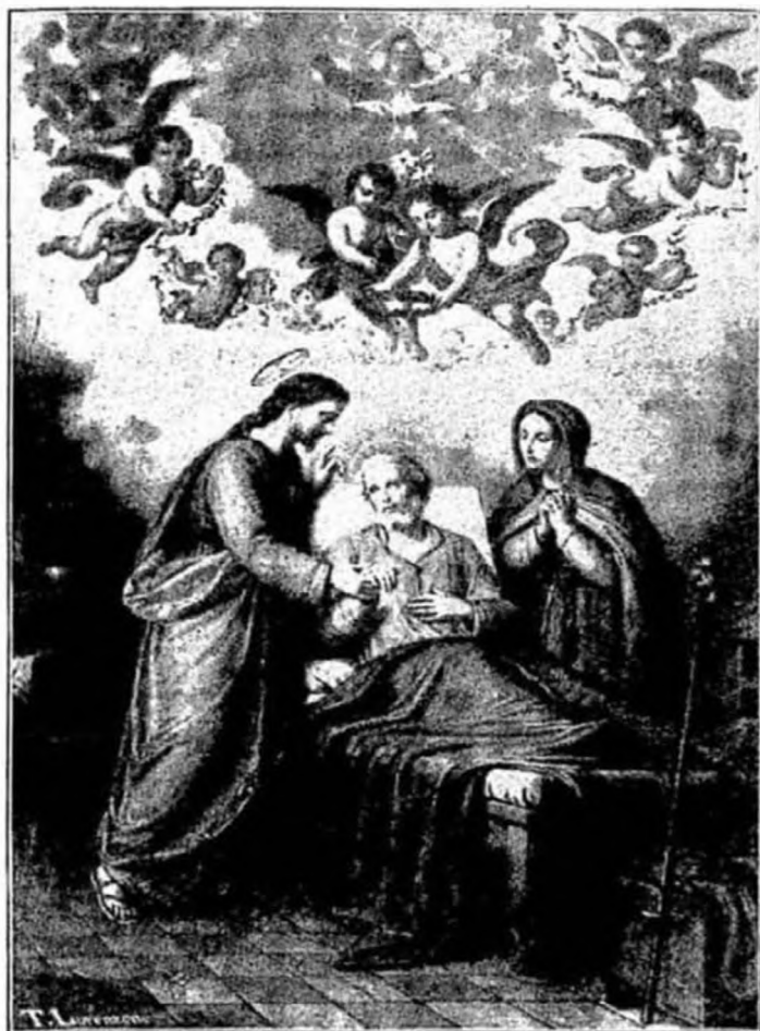
«Szent József boldog halála.»