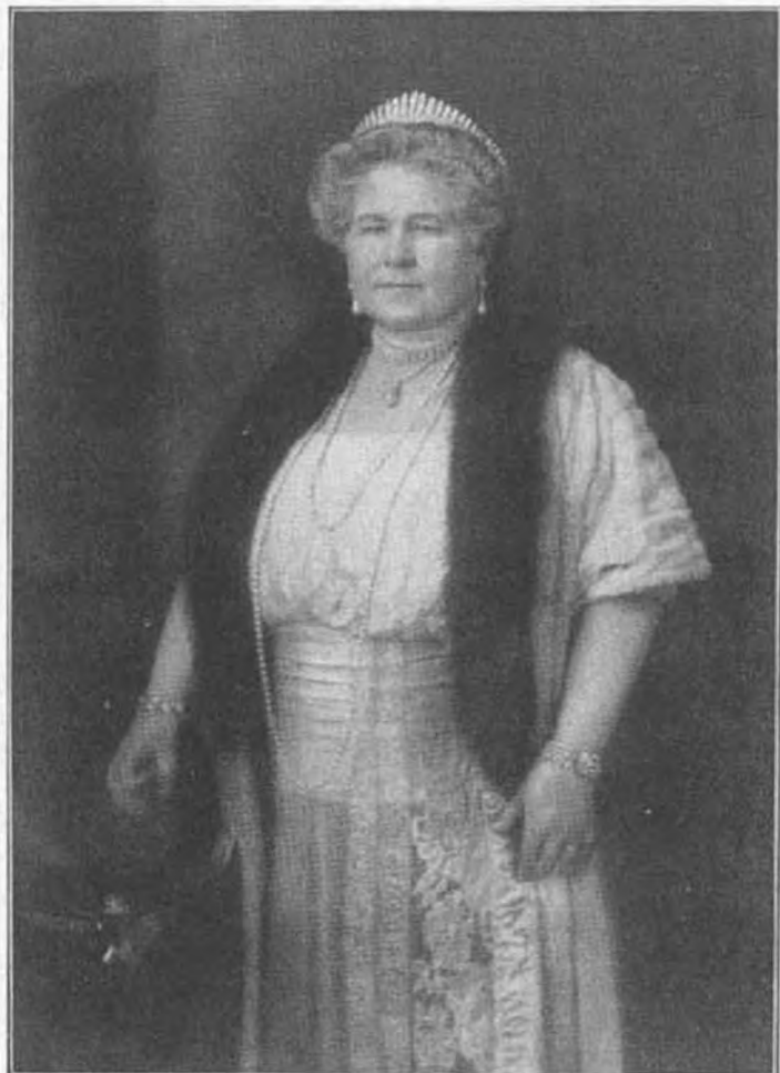
† IZABELLA FŐHERCEGASSZONY.

Dülmen hercegi családnak árpádházi leszármazását, IV. István királynak fiától, Márk hercegtől. S én ezt e helyen távolról sem azért említtem fel,