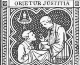
ET ABUNDANTIA PACIS.