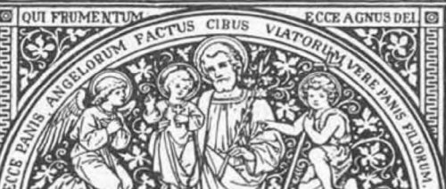
CUJUS NON SUM DIGNUS.