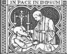
DORMIAM ET QUIESCAM