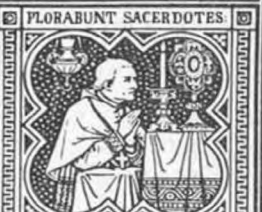
PARCE POPULO TUO.