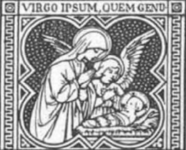
IT DEUM ADORAVIT.