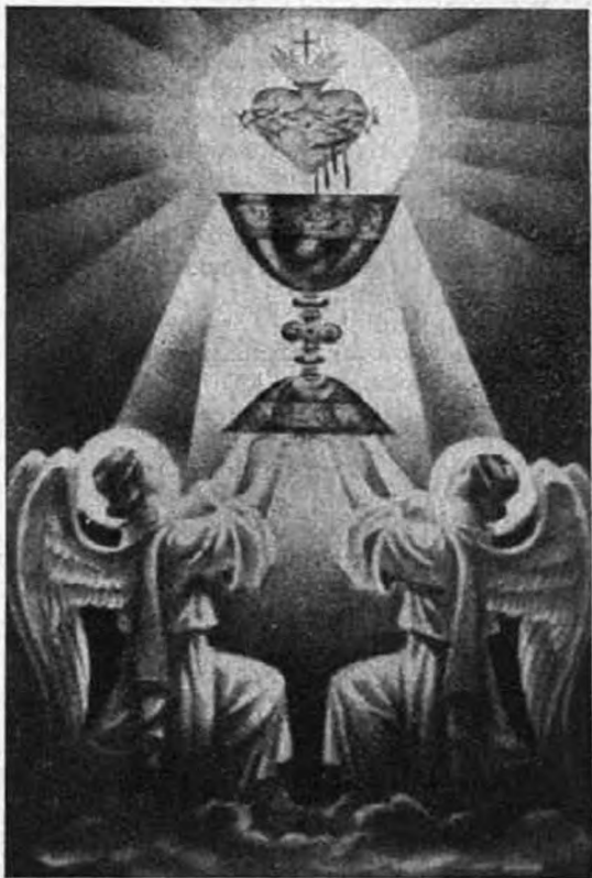
«Benned bízunk továbbra is!»

A veszprémi terv. Az ősszel, noha háromszor is megváltoztattuk a veszprémi oltáregyesületi nap dátumát, azt mégsem tarthattuk meg a mozgósítás miatt, mert elmaradt a dicsőséges Szent Jobbot vivő aranyvonat és ezzel kapcsolat-