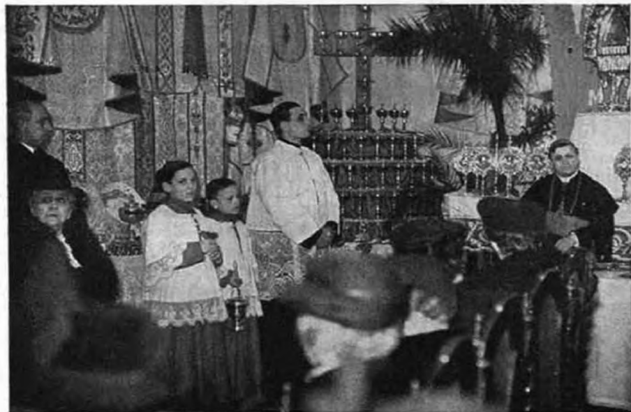
Kép a kiállítás megnyitásáról.

Eger ér. egyházmegyében 51 templom részesült segélyezésben, mégpedig küldtünk számukra 1 monstranciát, 8 kelyhet, 9 ciboriumot, 7 füstölőt tömjéntartóval, 4 aspersionumot, 5 csengőt, 11 könyvtartót, 6 kánontáblakészletet, 9 pár ampolnát tálcaival, 2 hordozható kazettát, 4 beteglátogató készletet, 1 beteglátogató-lámpát, 2 oltárfeszületet, 3 pacificalet, 1 öröklámpát, 1 sz. olajtartót,