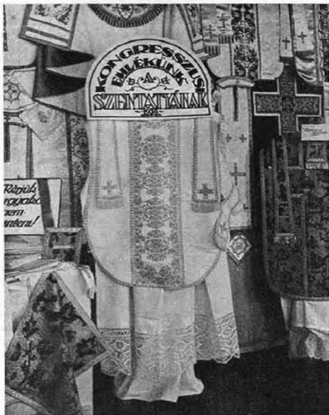
A pápai kazula.

a középosztályhoz tartozó asszonyok. A Szent Anna-kongregáció is páratlan buzgóságot fejt ki, tagjai főleg az iparos osztályból valók. A Szent Szív-kongregáció tagjai leginkább egyetemi hallgatónők s Zrinyi-leánygimnázium volt növendékei. Ők is kéthetenként tartják összejövetelüket és mindnyájan fiatalos buzgósággal töreksenek az eucharisztikus Úr Jézus dicsőségét előmozdítani. A Virgó Kongregáció I. csoportját művelt leányok és tisztviselőnők képezik és