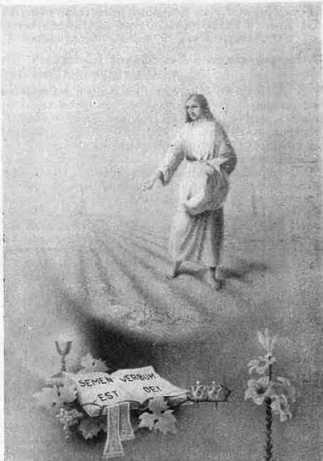
Az isteni Magvető a kongresszusi előkészületben.

Kiállításunk az elmúlt évben igazán méltó volt az eucharisztikus világkongresszushoz. Mérheteretlen munkával készült el. Rengeteg áldozat anyagiakban és munkaerőben. De volt is annyi minden együtt, amennyit még sohasem láttak az Oltáregyesület legrégebbi tagjai sem. Ha a körülmények és idő engedik — betakarhattuk volna vele nemcsak a kiállítás termeit, hanem az egész házat és a templom belsejét is. Belépőre különösen vonzóan és felemelően hatott a szent edényeknek Olcsvay Géza terve alapján készült elhelyezése. Középen a szárnyas oltár illúzióját keltő beállításban a kongresszusi nagy szentségtartó, mögötte sötétkéek alapon a kongresszusi jelmondat arany transzparensze. Tőle jobbra-