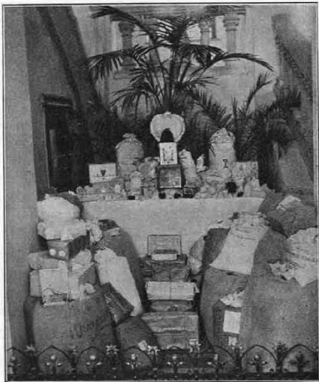
A kongresszusi búzaszemek tömege.

Az érseki helytartó részletesen felsorolta azokat az intézményeket és egyéneket, akik adományaikkal lehetővé tették, hogy közel 400 templom kapjon