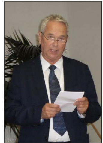
Polgárdy Imre a Veszprém Megyei Közgyűlés elnöke

A Himnusz eléneklése után Ferenczy Gáborné polgármester asszony köszöntötte a jelenlévőket és külön köszöntötte Polgárdy Imrét a Veszprém Megyei Közgyűlés elnökét, aki egyúttal megtartotta ünnepi beszédét is. A megye első számú embere hangsúlyozta, hogy azokra a férfiakra és nőkre emlékeztünk, akik átérték és véghezvitték saját forradalmukat. Azokra az egyetemistákra, akik október 23-án nagygyűlést tartottak az egyetemen, a bátor nemzetőrökre, a forradalmi tanács tagjaira. A testület újonnan megválasztott elnöke elmondta, hogy egyedül mi vagyunk felelősek saját hétköznapijainkért és ünne-