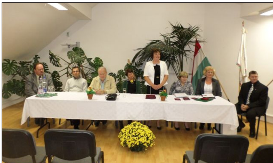
Alakuló ülés a faluház nagytermében