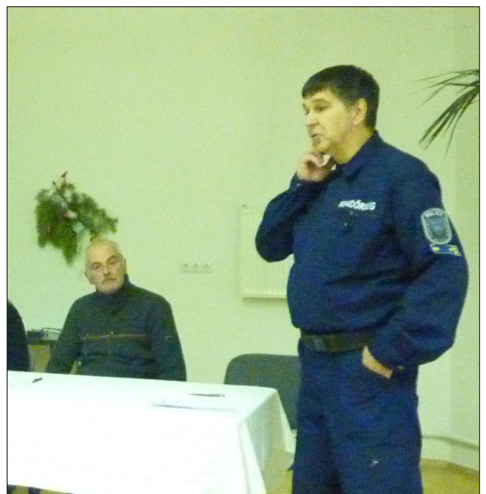
Novák-Nász Péter rendőr százados a közmeghallgatáson

A százados úr beszámolójában megköszönte az önkormányzat és a polgárórság konstruktív együttműködését, valamint a továbbiakban is kérte a határvadász járőrtárs képzéssel kapcsolatos rendőrségi toborzási tevékenységhez az önkormányzat segítségét.