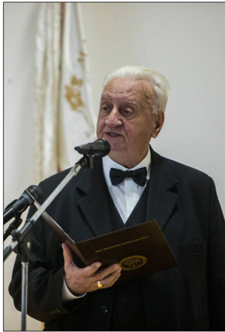
Huszár Pál a Magyarországi Református Egyház zsinatának világi elnöke