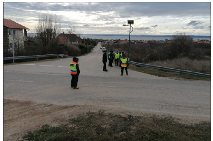
Vadhajtáson készült fotó