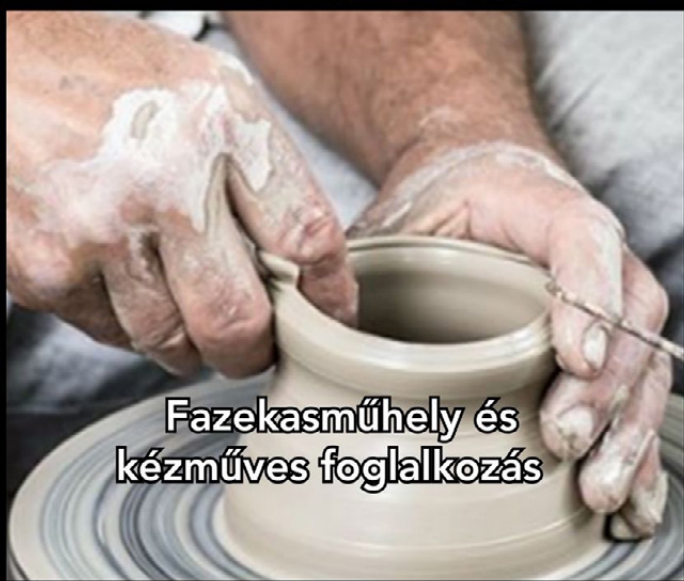
Fazekasműhely és kézműves foglalkozás

- csütörtökönként a Söptei pincészetnél borkóstoló