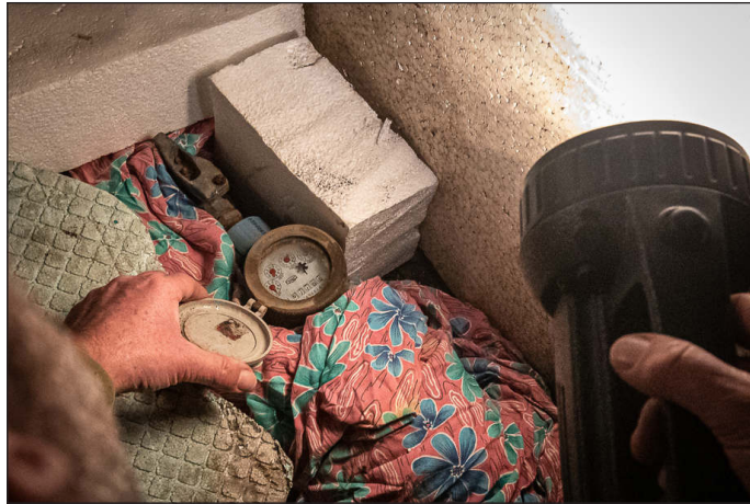
A vízmérőt akár pléddel, hungarocellel vagy más hőszigetelő anyaggal is letakarhatjuk.

szilánkokra tört üveg az óralapon, eldeformálódott számlálószerkezet, esetleg csöpögő víz fogadja a vízőra tulajdonosát télen, akkor szinte biztosra vehető, hogy elfagyott a mérőeszköz. Ugyanakkor intő jel lehet az is, ha a lakásban nem, vagy csak alig jön víz a csapból. Ebben az esetben gyanakodni lehet arra, hogy megfagyott a vezetékben a víz, amely tönkretette a mérőeszközt is. Nem árt tudni, hogy a fagy elleni védekezésről,