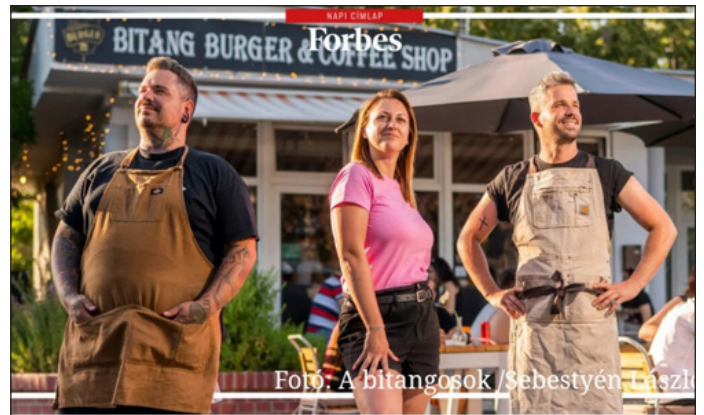
Fotó: A bitangosok / Sebestyén László

És tudjátok, van az az érzés, amikor elképzeled, hogy te vagy a címlapon, kicsit próbálsz magad elképzelni, hogy milyen érzés lehet. Mert álmodozni mindenki szokott! Ez az újság nem más volt, mint a Forbes! És ma ismét elfogott az érzés, amit anno akkor próbáltam elképzelni, de most sokkal jobb volt, mert mi voltunk ott azon a bizonyos képen. Gondolni se mertem, hogy egyszer benne leszek, leszünk. Rengeteg munka és kitartás után sikerült! Az egyik leg-