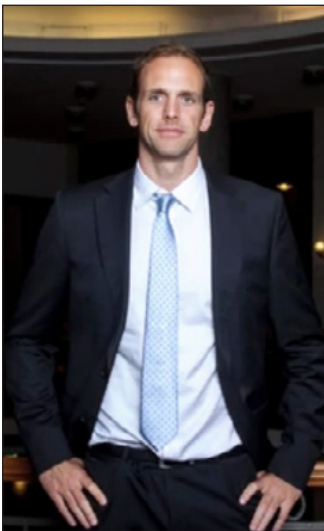
Kásás Tamás még keresi az útját

Kásás Tamás nem gondolta volna, hogy a vízilabda után nehezen találja meg a saját útját. Lassan tíz éve, hogy Kásás Tamás, háromszoros olimpiai bajnok visszavonult. A sportember ritkán ad interjút, ám most A nemzet aranyai című, az egykori csapatukról szóló film kedvéért kivételt tett. A film forgatása a napokban ért véget, a közönség az alkotást valószínűleg jövő tavasszal tekintheti meg.